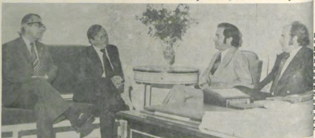
Neste encontro, a Telemig mostrou seus planos à UFV.

Segundo o diretor-presidente da Telemig, brigadeiro Theobaldo Antônio Kopp, a Empresa tem dois planos importantes para Viçosa: um, definitivo, que estará concluído em 1977, e outro, intermediário, que entrará em funcionamento no próximo mês de outubro. O plano definitivo, que é o sistema de Discagem Direta à Distância (DDD), será constituído de um conjunto de micro-ondas, o qual, partindo de Belo Horizonte, pas-