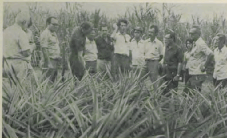
Ruralistas de Visconde do Rio Branco estiveram em contato com técnicos da UFV e da Acar.