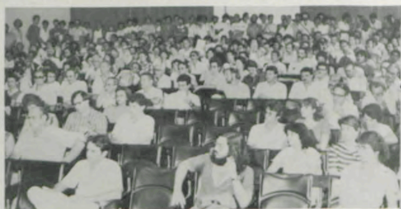
O plenário do Seminário.