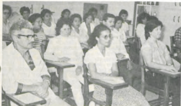
Grupo de participantes do curso.

O objetivo do curso, além da padronização de técnicas de enfermagem, é propiciar a atualização de conhecimentos técnicos, através de aulas teóricas e práticas.