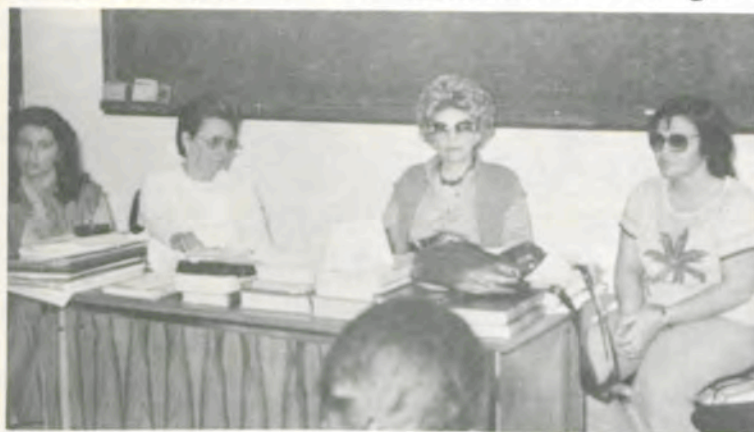
A mesa coordenadora dos trabalhos.