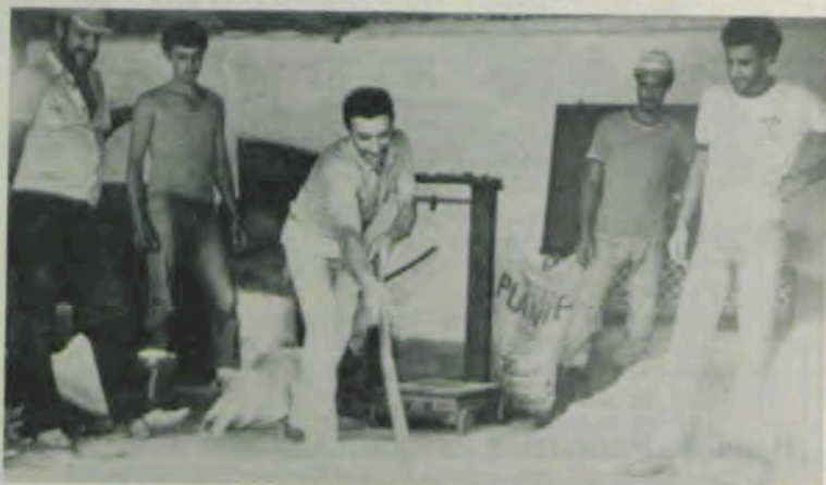
Aula prática de treinamento de retireiros.

Diversos grupos de trabalhadores e produtores rurais dos municípios atendidos pelo Programa Gilberto Melo,