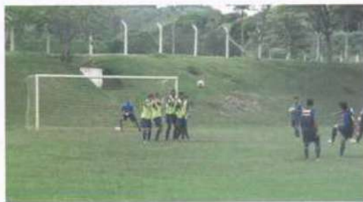
Os selecionados pela LUVE fazem treinos e disputam várias competições

Na área competitiva, a LUVE realiza, sempre no início do ano letivo, seletivas de estudantes para 19 modalidades esportivas. Os selecionados fazem treinos e disputam várias competições ao longo do ano. Entre elas, os Jogos do Interior de Minas (Jimi) , Jogos Universitários Mineiros e as Ligas Universitárias . Há também competições que acontecem no campus, como a Copa DCE de Futsal , que