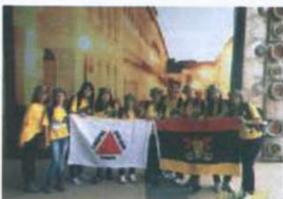
A equipe de rondonistas da UFV, durante a abertura das operações, em São Luís (MA)

A Divisão também apóia o Projeto Rondon, coordenado