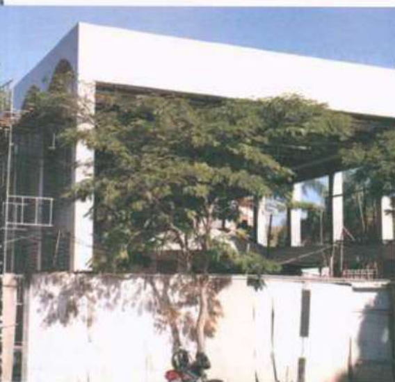
O Prédio da Química (1ª foto da página), o Espaço Cultural Fluxo da Dança (acima à esquerda) terão salas de aulas e auditórios

Editora UFV: incentivo ao crescimento acadêmico e cultural