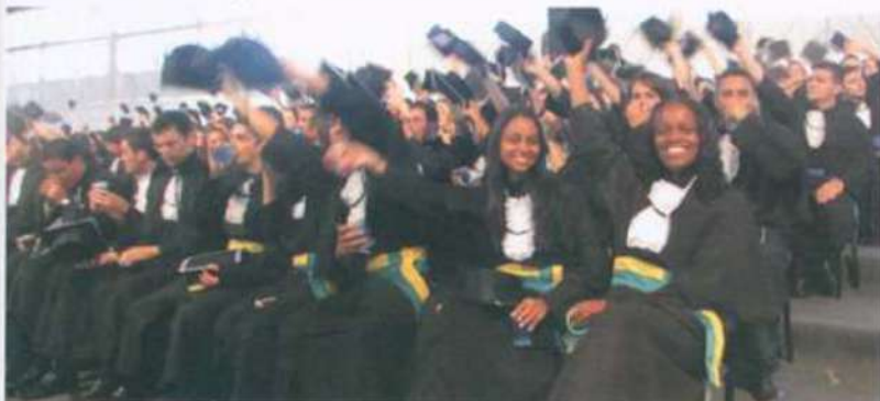
A Pró-Reitoria de Ensino é responsável pela vida acadêmica do estudante: da matrícula à formatura