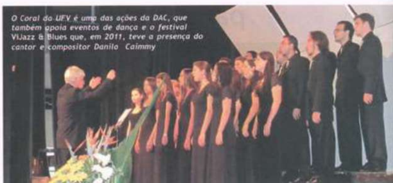
O Coral da UFV é uma das ações da DAC, que também apoia eventos de dança e o festival VJazz & Blues que, em 2011, teve a presença do cantor e compositor Danilo Caymmi