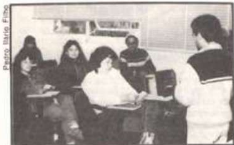
Aspecto de um dos seminários do Curso de Especialização.

Terminou ontem, quinta-feira, o segundo módulo do Curso de Especialização em Educação Física e Desporto Escolar do Departamento de Educação Física (DES) da Universidade Federal de Viçosa. O curso é ministrado em nível de pós-graduação "latu sensu" e subdivide-se em três módulos. O primeiro aconteceu em janeiro deste ano e o terceiro deverá ser realizado em janeiro de 1991.