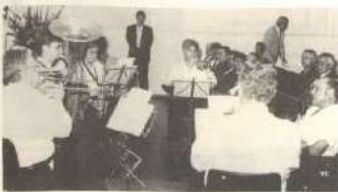
A sessão solene foi abrilhantada por uma apresentação do Quinteto de Música de Viçosa.