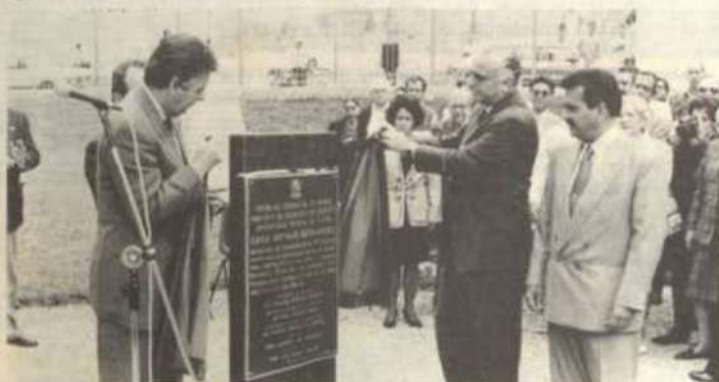
O vice-governador Walfrido dos Mares Guia (esq.) e o ministro Paulo Renato Souza fazem o descerramento da placa comemorativa.

A Universidade Federal de Viçosa promoveu, nos últimos dias, uma série de eventos comemorativos para marcar a passagem dos 70 anos de sua fundação. Durante as comemorações, estiveram presentes várias autoridades e membros das comunidades acadêmica e viçosense, em atos cívicos, religiosos e socioculturais.