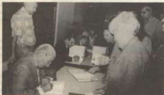
Os autores autografam suas obras.

Outro evento da programação comemorativa, carregado de significado, foi o lançamento de diversas obras, no final da tarde do dia 27. A cerimônia, no auditório e no saguão da Biblioteca Central, reuniu grande número de membros da comunidade acadêmica.