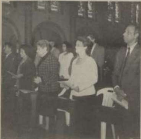
Momento de oração no Santuário de Santa Rita de Cássia.

O dia 25 foi marcado pelas cerimônias religiosas em ação de graças. O primeiro ato comemorativo oficial foi o hasteamento de bandeiras na praça principal do campus, com a participação de autoridades universitárias e do Tiro de Guerra de Viçosa.