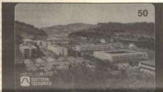
Fac-símile do cartão telefônico em homenagem à UFV