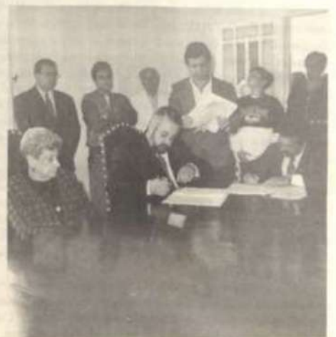
Dirigentes da ACTIV e da UFV assinam o documento de transferência do acervo fotográfico.