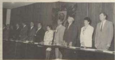
Astreladas que compuseram a música da sessão solene.