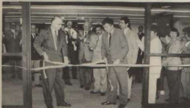
O vice-governador Walfrido dos Mares Guia e o ministro Paulo Renato Souza participam da solenidade.