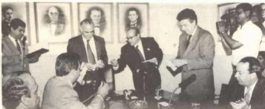
O ministro Paulo Renato Souza recebe o cartão telefônico do presidente da Telemig, Saulo Coelho.