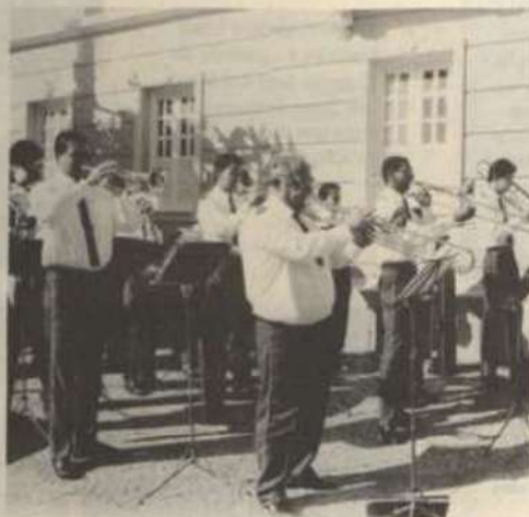
A Lira Santa Rita faz sua apresentação, momentos antes da bênção da Casa Arthur Bernardes.