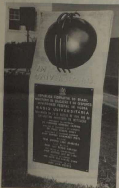
A placa que marca realização da solenidade e o símbolo da emissora.