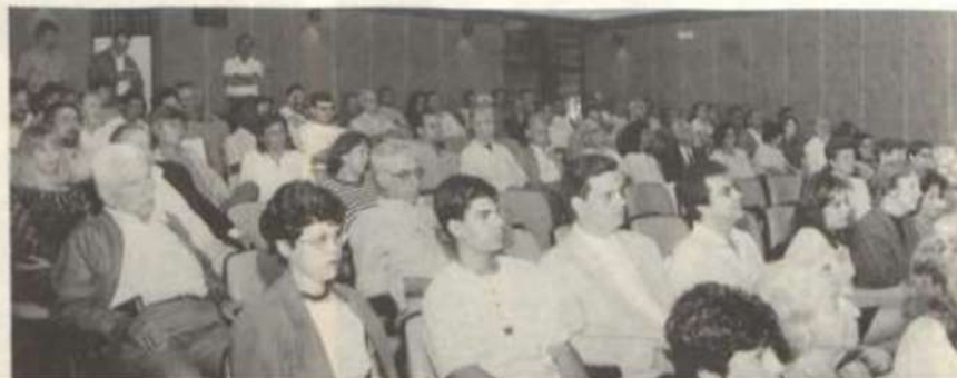
Público presente à solenidade de lançamento.