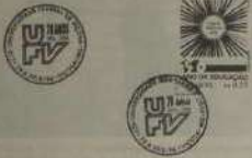
Foi símbolo de caridade com o carimbo comemorativo lançado pela ECT.