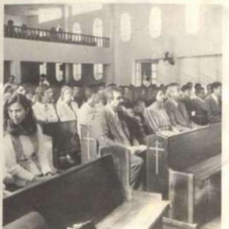
Grande número de fiéis participou do Culto Evangélico na Igreja Presbiteriana.