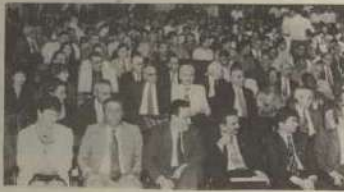
Parte do público presente à cerimônia.