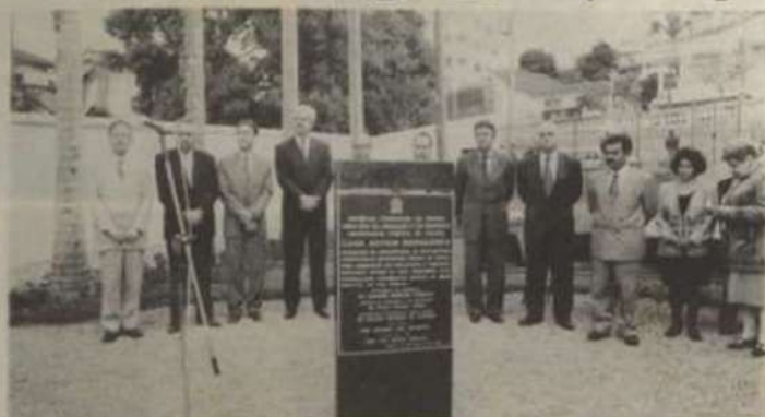
A cerimônia de inauguração da Casa Arthur Bernardes contou com diversas personalidades, destacando-se a presença de familiares do ex-Presidente.