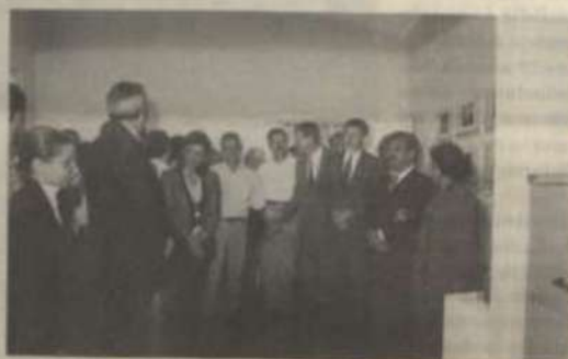
Parte do público presente ao ato inaugural.