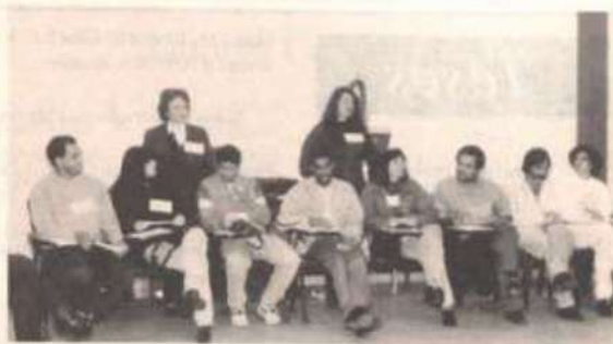
Alguns participantes da segunda fase do treinamento, junto às técnicas do Serviço Psicossocial (em pé).

Foi realizada nos dias 12 e 13 deste mês, na Sala 237-A da Biblioteca Central (BBT) da Universidade Federal de Viçosa, a segunda fase do treinamento (Módulo IV) do Programa de Capacitação e Desenvolvimento dos Recursos Humanos da BBT, promovido pela Diretoria de Recursos Humanos (DRH), por meio do Serviço de Desenvolvimento de Pessoal (SDP).