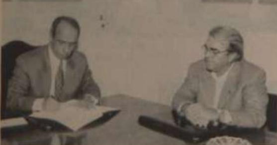
Assinatura do convênio na Sala de Reuniões da Reitoria da UFV.