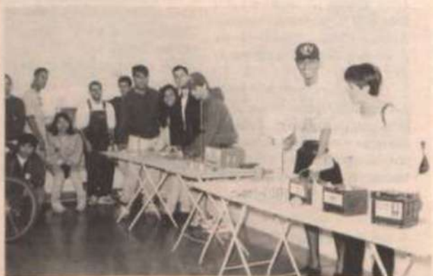
Aspecto da mostra no Centro de Vivência.