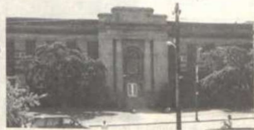
Um dos prédios da Universidade Técnica de Nova Scotia, em Halifax.