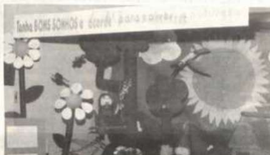
Aspecto da vitrine vencedora.