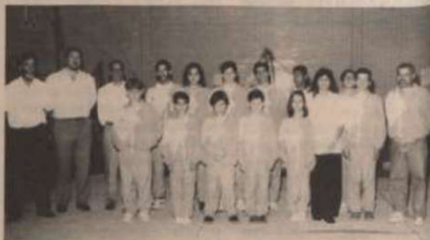
Equipe de ginastas da UFV.

a interação entre ginastas iniciantes, por isso, não se trata de competição e sim de apresentação, em que todos os atletas com índice de 75% de aproveitamento são premiados. Na Copa UFV deste ano, todos os 220 ginastas participantes representando as cidades de Viçosa, Ubá, Ipatinga, Ouro Preto, Belo Horizonte e Rio de Janeiro, alcançaram o índice e receberam medalhas.