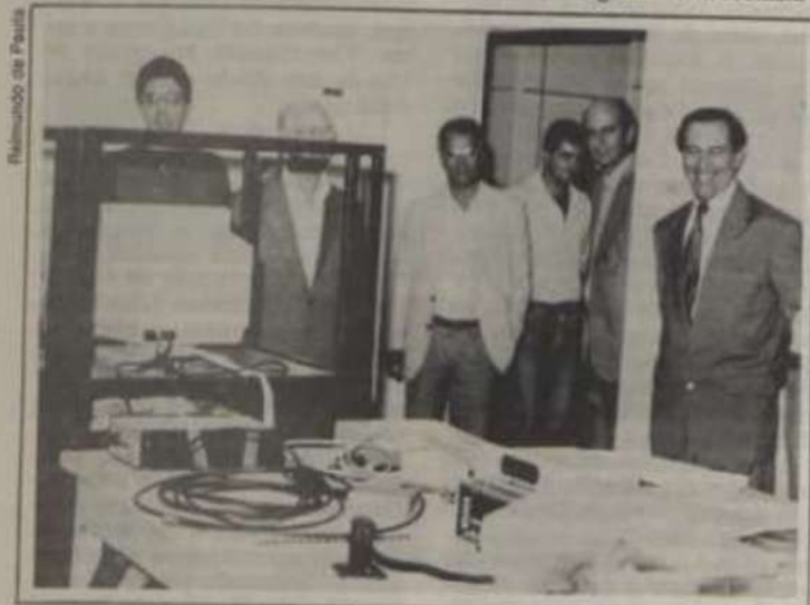
As instalações dos laboratórios do Departamento de Física da UFV.

Professores, pesquisadores de instituições públicas e privadas, representantes de empresas e profissionais liberais, além de estudantes de graduação e pós-graduação, deverão participar deste Simpósio.