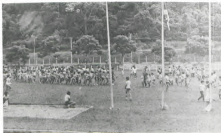
Colônia de Férias da UFV.

Com suas atividades intensas, o Departamento de Educação Física da UFV vem desempenhando um papel importante na formação de futuros atletas, em diversas modalidades, de acordo com os objetivos do governo federal, e também contribuindo para maior integração entre a Universidade e a comunidade.