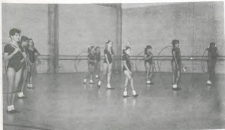
Ginástica Rítmica Desportiva.

No transcorrer da Semana da Criança, o Departamento de Educação Física do Centro de Ciências Biológicas e da Saúde da Universidade Federal de Viçosa expressa sua homenagem à criança. Nos dias de hoje, ela vem merecendo atenção especial do governo e do povo, dos pais e educadores, das escolas e associações etc.