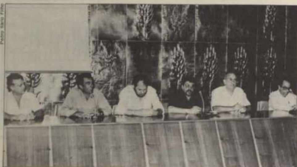
O diretor geral do Centreinar (segundo a partir da esquerda) dá as boas-vindas aos extensionistas estrangeiros, ladeado pelo representante da FAO (primeiro à sua esquerda) e demais componentes da mesa.

O Centro Nacional de Treinamento em Armazenagem (Centreinar), localizado no campus da Universidade Federal de Viçosa, iniciou, no dia sete deste mês, a primeira fase dos cursos previstos no Programa de Treinamento de Extensionistas em Tecnologia de Pós-Colheita para a América Latina e o Caribe, conforme acordo feito entre o governo brasileiro e a Organização para Alimentação e Agricultura (FAO) da Organização das Nações Unidas (ONU), com recursos do governo japonês.