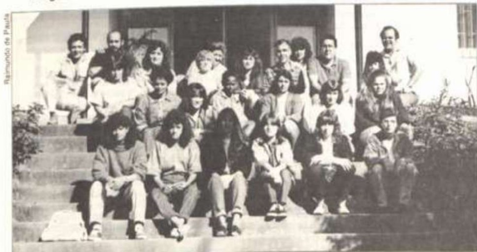
Na foto, as participantes e os coordenadores do curso.