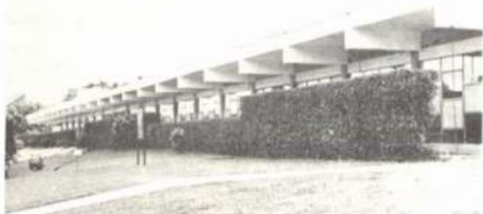
O pavilhão de aulas.

Os candidatos devem dirigir-se à Comissão Permanente de Vestibular da UFV, tel. (031) 891-1790, ramais 113, 190 e 335 — 36570 — Viçosa-MG; ao Escritório da Reitoria da UFV, Rua Rio de Janeiro, 1.662, tel. (031) 337-4744 — 30000 — Belo Horizonte-MG; ou ao Escritório de Representação da UFV, Avenida W3 Norte — Quadra 702 — Bloco P, Ed. Brasília Rádio Center — s/2.117 e 2.118, telex (061) 226-4107, 226-4409 e 225-3820 — 70710 — Brasília-DF.