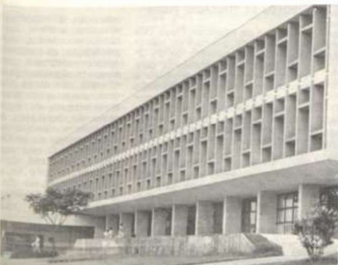
O Edifício Reinaldo de Jesus Araújo.

As inscrições para o Vestibular/1986 da Universidade Federal de Viçosa (UFV) estarão abertas no período de 14 de outubro a 1.º de novembro. As provas serão realizadas entre cinco e oito de janeiro de 1986 e são oferecidas 1.050 vagas, em 22 cursos, nas áreas de Ciências Agrárias, Ciências Biológicas e da Saúde, Ciências Exatas e Tecnológicas e Ciências Humanas, Letras e Artes.