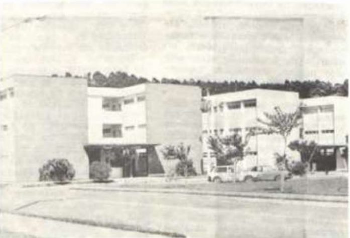
Os alojamentos masculinos.