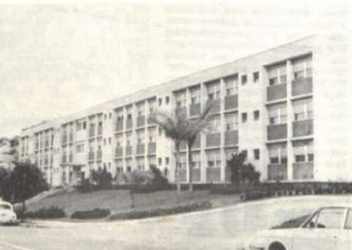
O alojamento feminino.