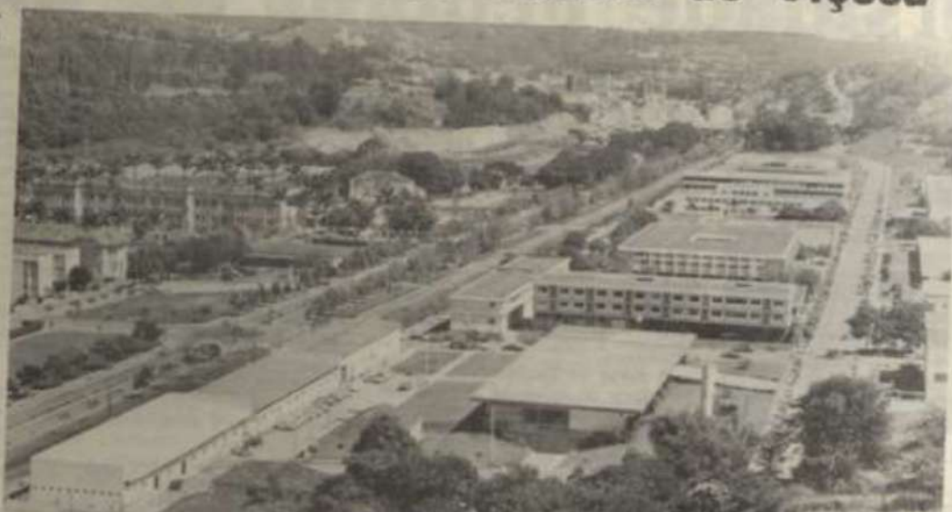
Vista parcial do «campus» universitário.

LUNI) é o órgão que se ocupa do 2º grau na UFV, agindo como continuista da idéia de se formar o profissional desde as raízes.