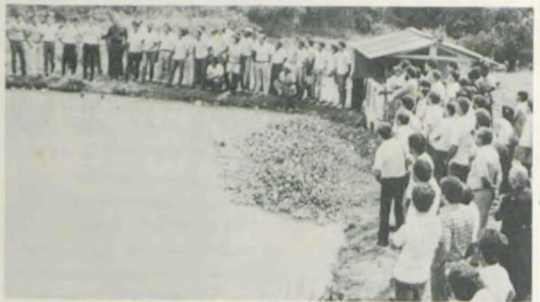
Demonstração prática, na Fazenda São José.

Os trabalhos iniciais no desenvolvimento da piscicultura ocorreram em Viçosa, quando a UFV e a Epamig celebraram um convênio que permitiu a instalação de uma estação de hidrobiologia e piscicultura no "campus" universitário. Mais recentemente, houve o envolvimento da Emater-MG no processo de difusão do produto, fazendo com que as pesquisas desenvolvidas em Viçosa chegassem ao produtor rural.