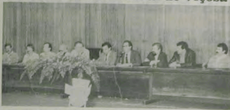
A mesa da solenidade de abertura da I Semana do Empresário.

Visando promover a integração de empresários e executivos com a Universidade e incentivar o intercâmbio entre pequenas e microempresas, levando conhecimentos técnicos e gerenciais aos produtores urbanos, mediante a realização de cursos, debates, palestras, mesas-redondas e exposição de produtos, a Universidade Federal de Viçosa está promovendo a I Semana do Empresário, iniciada terça-feira última, com a presença de participantes de Viçosa e de cidades da região. O encerramento da programação será nesta sexta-feira.