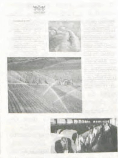
Fac-símile das páginas com a reportagem sobre a UFV.