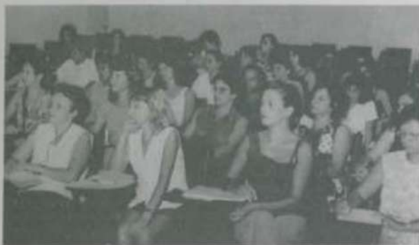
Parte dos professores que participaram do Treinamento Suplementar, no início de abril.

O Pólo 5, do Programa de Capacitação de Professores das quatro primeiras séries do Ensino fundamental das redes estadual e municipal de Minas Gerais (Procap), coordenado pela Universidade Federal de Viçosa, promoveu o treinamento suplementar especial para professores da APAE e do pré-primário, no período de dois a oito de abril, no Centro de Ensino de Extensão (CEE).