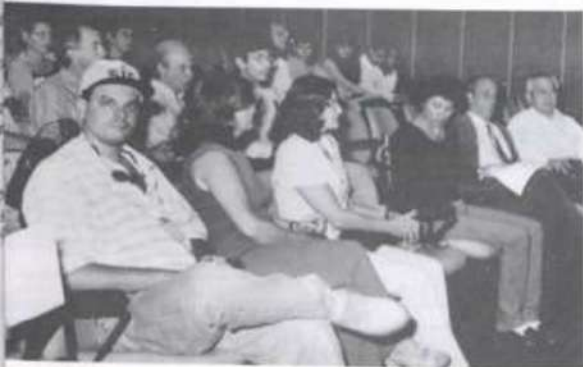
Empresários, coordenadores da visita técnica e dirigentes da UFV durante a reunião de avaliação do encontro.

Terminada essa etapa, todos se reuniram para uma avaliação da visita, no auditório da Biblioteca Central. Os representantes da UFV e dos empresários de cada um dos grupos manifestaram seu contentamento em função dos resultados promissores dos contatos realizados, enfatizando a abertura de novos campos, com reais benefícios para ambas as partes.