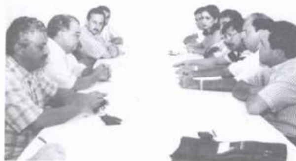
Participantes do encontro em uma das reuniões.

Houve ainda ampla discussão em busca de um consenso sobre os