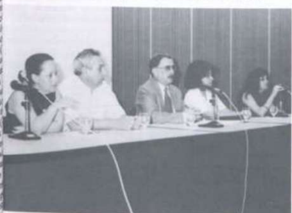
Mesa que presidiu a sessão de abertura do treinamento.