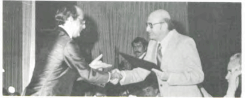
A entrega dos diplomas referentes ao jubileu de prata.

Domingo, houve uma reunião de confraternização dos ex-alunos, seguindo-se visitas ao «campus», churrasco comemorativo da 44. a Reunião, posse da nova diretoria da entidade e encerramento da reunião anual.