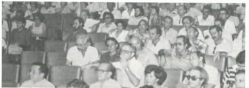
Os ex-alunos, durante a palestra do reitor.