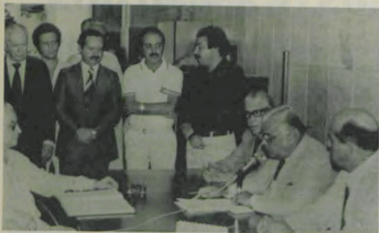
Um empréstimo de grande alcance social.

Um empréstimo de grande alcance social, no valor de Cr$ 8.413.000,00, foi concedido pela Caixa Econômica Federal, através do Fundo de Apoio Social, ao Hospital São Sebastião, de Viçosa, para o término das obras de sua ampliação.