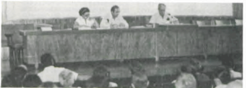
A reunião da Diretoria da Associação com os ex-alunos.