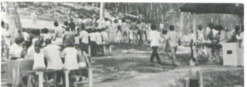
Um aspecto do churrasco, no Recanto das Cigarras.