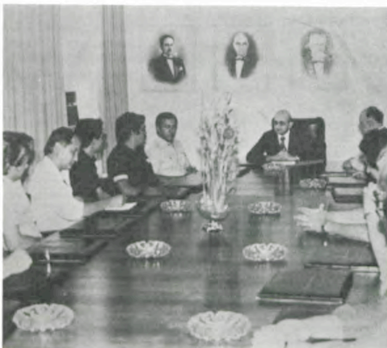
A assinatura do contrato foi na Reitoria.

A Universidade Federal de Viçosa e a Agência do Banco do Brasil em Viçosa assinaram, segunda-feira, na Reitoria da UFV, um contrato de abertura de crédito, no valor de dez milhões de cruzeiros, para auxiliar nos investimentos da UFV em suas atividades de ensino, pesquisa e extensão.