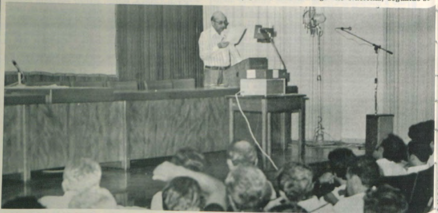
A palestra do reitor da UFV estava na pauta da 44. a Reunião.

nharia Florestal, a UFV homenageou os ex-alunos que completavam o jubileu de prata de formatura, numa sessão solene que iniciou, às 21h, com a execução do Hino Nacional, seguindo-se a