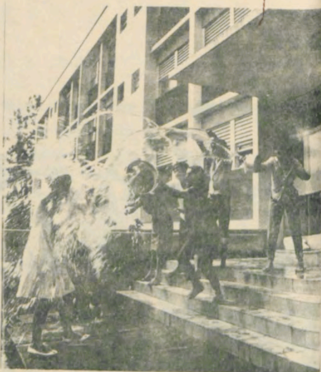
Alunos da Escola Superior de Ciências Domésticas em Viçosa, apresentando produtos agrícolas em uma feira.