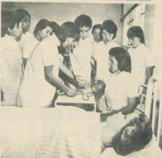
A ESCOLA SUPERIOR de Ciências Biológicas tem por finalidades: a Educação e a Pesquisa. O Curso de Ciências Biológicas é realizado com os demais cursos, sob a orientação da Universidade. Além dos cursos de sua instituição, os trabalhos de pesquisa de caráter científico e tecnológico são desenvolvidos em suas dependências. Os cursos de graduação são oferecidos em suas dependências, além das oportunidades de especialização em suas dependências, sob a orientação dos professores. O curso de graduação é oferecido com o intuito de proporcionar aos alunos conhecimentos técnicos e teóricos, além da preparação da família brasileira. Essas atividades também servem à preparação da família brasileira.