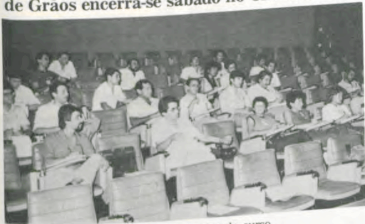
Técnicos participantes do curso.

Encerrar-se-á neste sábado, no Centro Nacional de Treinamento em Armazenamento (CENTREINAR), o VI Curso Internacional de Armazenamento de Grãos, que contou com a participação de representantes de 13 países e, inclusive, da indústria nacional. O Curso iniciou-se no dia seis do corrente.