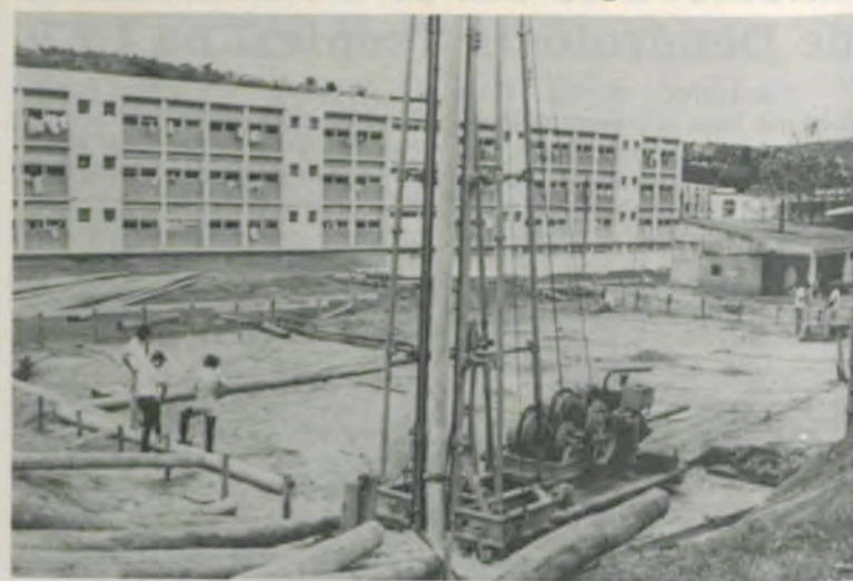
As obras prosseguem em ritmo acelerado.

Biotecnologia da UFV laboratórios de pesquisas nas seguintes áreas: Fermentação, Enzimologia, Genética de microrganismos, Engenharia genética, Micorriza, Microbiologia, Microbiologia do solo, Proteína de unicelulares, Laboratório de análises, Fixação biológica do nitrogênio, Controle biológico, Biometalurgia e Desenvolvimento de tecnologia e equipamentos de grande porte.