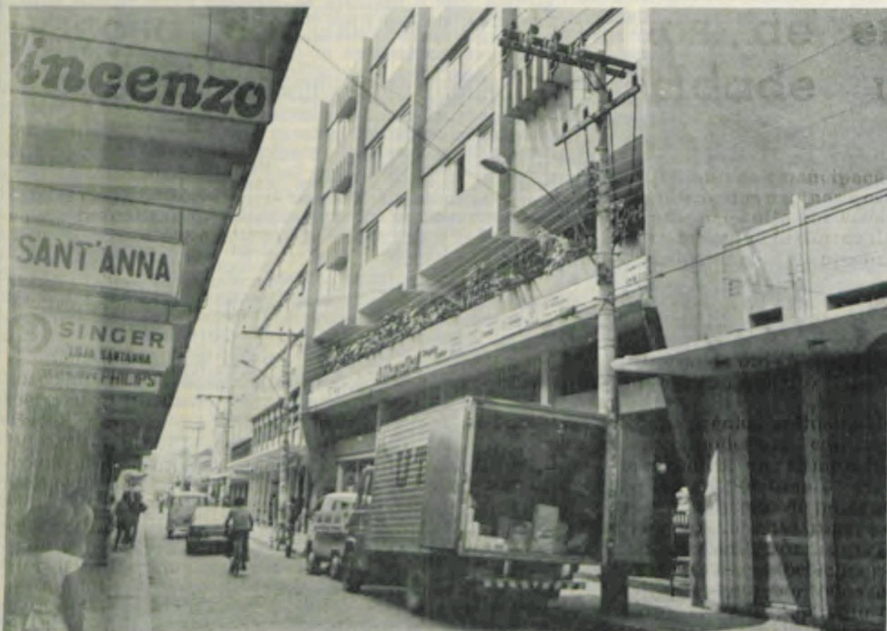
A rua Arthur Bernardes.

«Viçosa, por seu passado, mas também e principalmente por seu presente, te