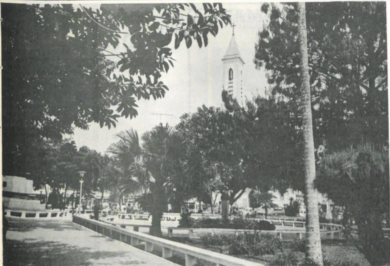
A praça Silviano Brandão.

uma posição de destaque no Brasil. Sua Universidade Federal, no campo da Pesquisa, do Ensino e da Extensão, é um modelo que eleva a educação superior no Brasil», disse o ministro Ney Braga, da Educação e Cultura, ao paraninfar, ainda há pouco, uma das turmas de novos profissionais que a Universidade entregou ao País.