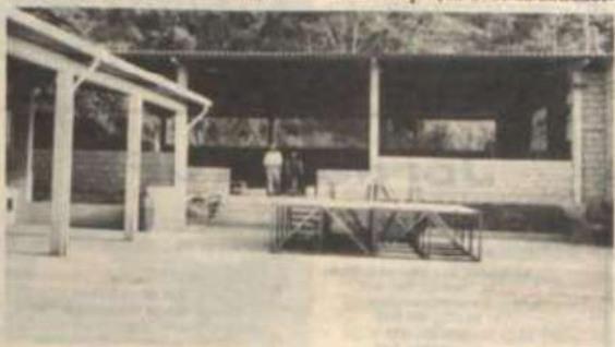
Novo espaço à disposição dos ex-alunos.

No domingo, 15, a partir do meio-dia haverá churrasco de confraternização, na sede da entidade.