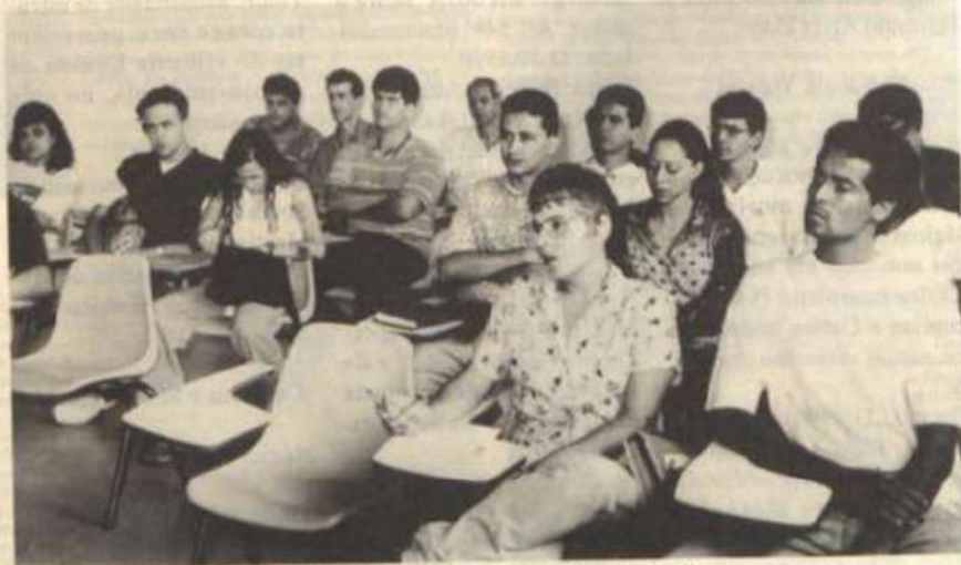
Estagiários selecionados para a execução dos trabalhos.

O trabalho dos estagiários, que deverá ser realizado em 15 dias, teve início no último dia 23, sendo que o professor Eloy, na quarta-feira dessa semana, também iniciou viagem por todo o Estado, com o objetivo de fiscalizar os trabalhos que estão sendo desenvolvidos.