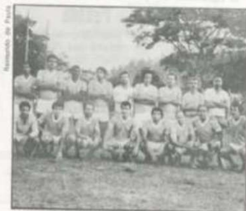
A equipe da Diretoria de Material vem obtendo bons resultados.

São estes os próximos jogos: dia 30/11 — Salva-Vidas x Vigilância, 1º/12 — Bandeirão x Parques e Jardins, 2º/12 — CCE x Química, 4º/12 — Prédio