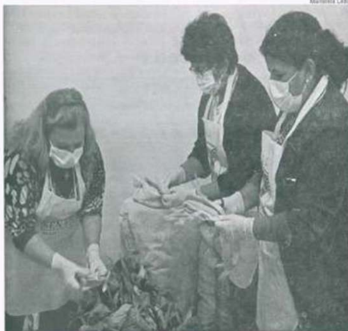
Artesanato: curso ensina a fazer bonecas com palha de milho

SUPLEMENTO ESPECIAL PUBLICAÇÃO DA UNIVERSIDADE FEDERAL DE VIÇOSA