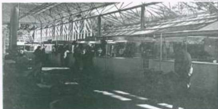
Os bares se encontram no Multiuso e oferecem comidas típicas de fazendas

Os preços dos pratos variam de 5 a 30 reais e os bares ficarão abertos durante toda a semana.