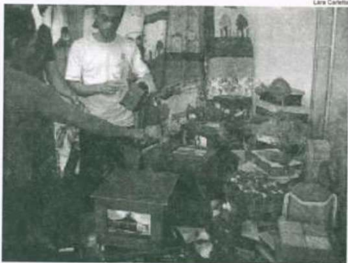
Caixas de madeira, bonecas, quadros, panos de prato compõem a variedade da feira

Toda esta diversidade de produtos estará no espaço Multiuso até sábado, 18, após o término das atividades da Semana do Fazendeiro.