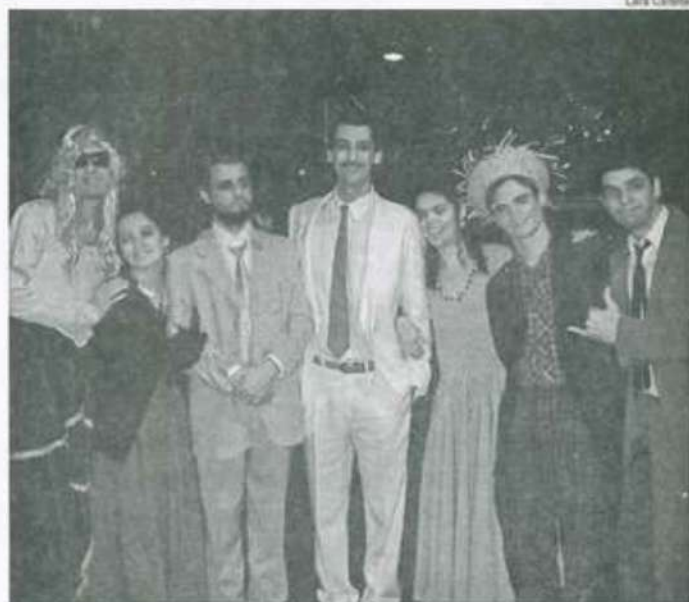
Atores que encenaram o espetáculo no espaço Multiuso na noite de ontem