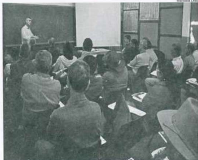
Curso: Cultura da cana de açúcar, plantio e manejo

Ainda outros cursos de auxílio no cotidiano fizeram parte do primeiro dia da Semana do Fazendeiro, como o curso de Sabão Rural; Natureza Cores e Interiores; Modelagem do vestuário; Economizando Energia Elétrica e Planejamento do Controle Orçamentário doméstico.