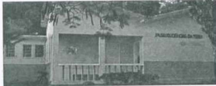
Fachada do Museu de Ciências da Terra Alexis Dorofeef que faz parte do circuito

Além de variados cursos e programações culturais, um pouco da memória da UFV está sendo disponibilizada aos participantes por meio do Circuito de Museus.