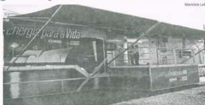
Carreta da Cemig estacionado enfrente o Centro de Vivência

A carreta está localizada em frente do Centro de Vivências e fica aberta das 13 às 22 horas.