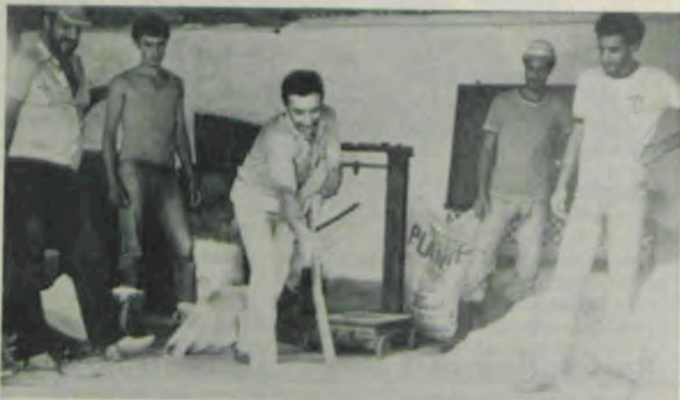
Aula prática de treinamento de retirados.

Diversos grupos de trabalhadores e produtores rurais dos municípios atendidos pelo Programa Gilberto Melo,