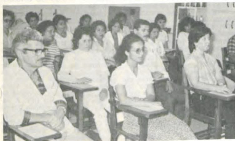
Grupo de participantes do curso.

O objetivo do curso, além da padronização de técnicas de enfermagem, é propiciar a atualização de conhecimentos técnicos, através de aulas teóricas e práticas.