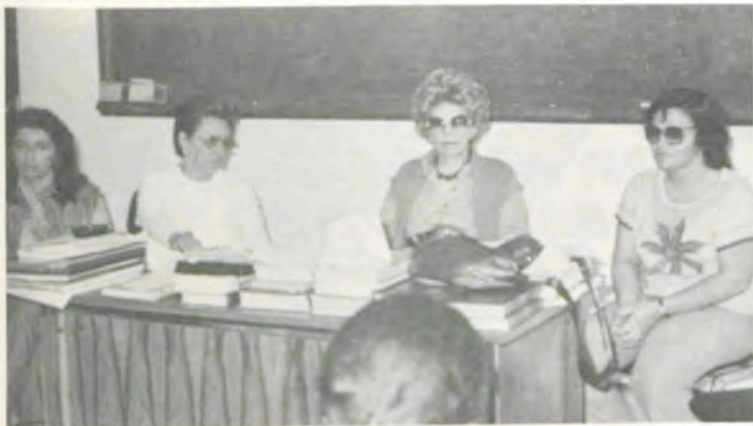
A mesa coordenadora dos trabalhos.