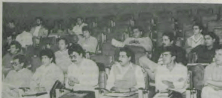
Os participantes do curso.

Com o objetivo de contribuir para maior difusão tecnológica do armazenamento de grãos na América Latina, já que a conservação da qualidade dos grãos e a redução das perdas pós-colheita são hoje uma questão vital em todo o mundo, o Centro Nacional de Treinamento em Armazenagem (CENTREINAR) começou, nesta segunda-feira, dia sete, no Campus da Universidade Federal de Viçosa, o VIII Curso Internacional de Armazenamento de Grãos. Estão participando 34 técnicos e pesquisadores de nível superior do Brasil e de vários países da América Latina, tais como Argentina, Costa Rica, México, Honduras e Panamá, entre outros. O curso será desenvolvido em duas etapas principais, sendo que esta primeira, a ser encerrada no dia 18 deste mês, consta de aulas, palestras e debates sobre os diversos aspectos técnicos pertinentes à armazena-