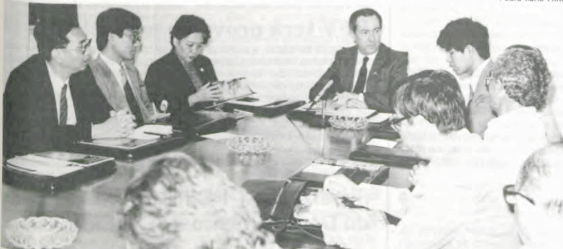
O encontro dos visitantes com o reitor da UFV transcorreu em clima de cordialidade.