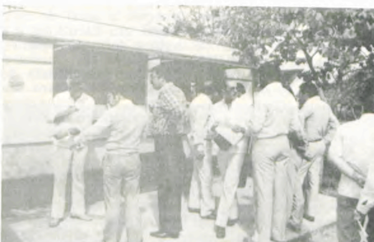
A inauguração de um dos «trailer», no «campus» universitário.