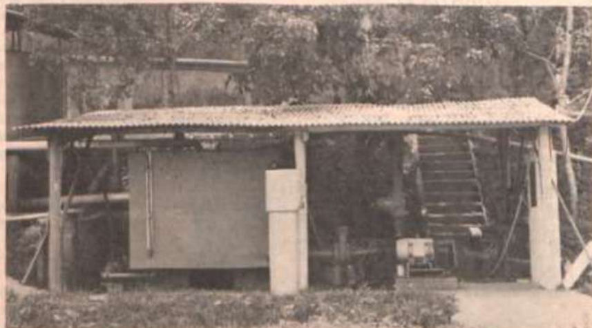
O protótipo da bomba, montado no campus da UFV.

O trabalho realizado no DEA é inédito no País e, certamente, será fonte de referência não apenas para outras pesquisas como também, e principalmente, para atender a produtores e, ou,