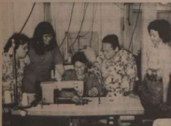
Participantes do curso.

Foi encerrado, no Laboratório de Vestuário Industrial da UFV, o curso sobre Manuseio e