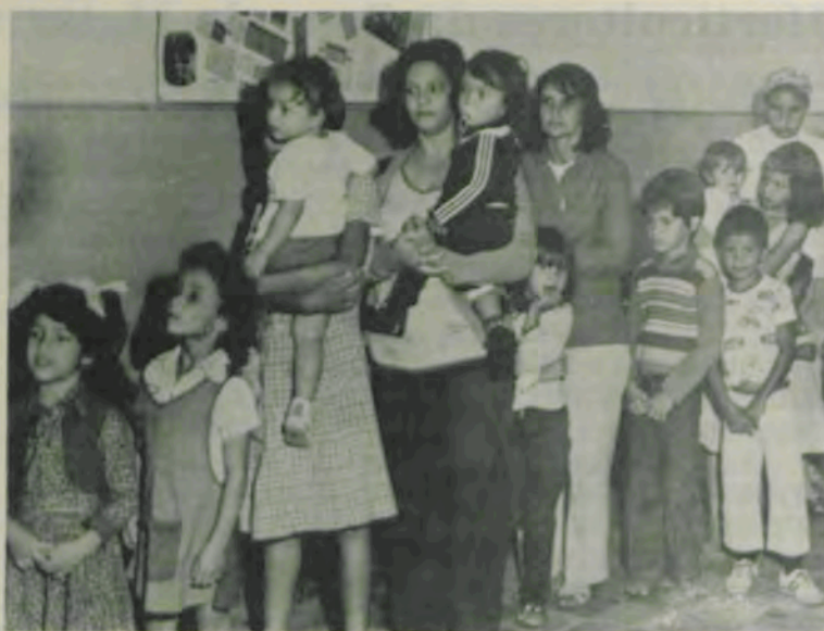
A vacinação, com a primeira dose, alcançou pleno êxito na região de Viçosa.

Neste sábado, será realizada, em Viçosa e zona rural, a vacinação contra paralisia infantil, promovida pelo Ministério da Saúde, por intermédio da Campanha de Vacinação contra Paralisia Infantil, com a colaboração da Universidade Federal de Viçosa, Centro Regional de Saúde de Ponte Nova, Emater-MG e prefeituras municipais de Araponga, Canaã, Cajuri, Coimbra, Ervália, São Miguel do Anta, Teixeira e Viçosa. A vacinação, segunda dose, será feita em crianças recém-nascidas e até cinco anos.