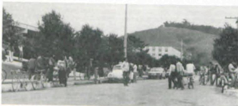
O "campus" está movimentado com a chegada dos estudantes.

Segunda-feira, foram reiniciadas as aulas na Universidade Federal de Viçosa, referentes ao segundo período letivo. O "campus" está com muita movimentação, durante todo o dia, com cerca de 5000 estudantes frequentando os diversos cursos universitários, o pavilhão de aulas, o ginásio esportivo, a biblioteca central etc.