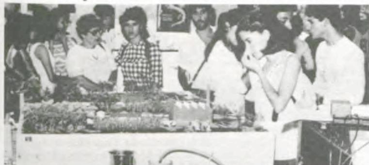
O trabalho "Evolução do cerrado" foi um dos premiados em 1º lugar.

No Centro de Vivência da Universidade Federal de Viçosa (UFV), foi realizada, nos dias 1º a cinco do corrente, a I Feira de Ciências do Colégio Universitário (Coluni), promovida por seus alunos, professores e servidores, com apoio da Diretoria de Assuntos Culturais, Conselho de Extensão e outros Departamentos da UFV.