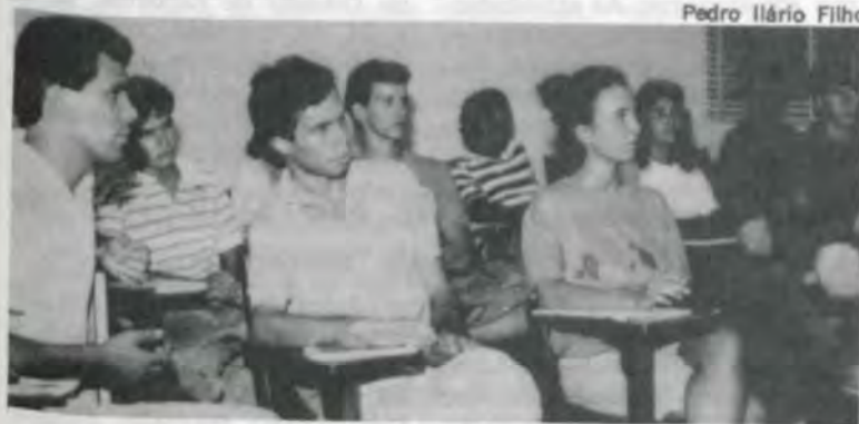
Alguns dos participantes do curso.

Terminam hoje, na Universidade Federal de Viçosa, os cursos de Introdução à Programação I (Linguagem Pascal) e Programação Aplicada (WS e DEBASE III Plus), que estão sendo oferecidos a 40 alunos, pelo Departamento de Matemática (DMA). Dentre outros objetivos, os principais são: proporcionar aos estudantes do curso de Informática da UFV um treinamento extra-curricular e, à comunidade acadêmica, oportunidade de travar contato com o computador, ferramenta indispensável no mundo atual. Coordenados por professores da área de Informática do DMA e ministrados por alunos do curso de Bacharelado em