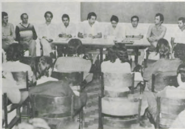
A mesa dos trabalhos, na abertura do 7.º Curso.

Dois cursos para engenheiros-agrônimos do Sistema de Assessoramento Técnico a Nível de Carteira do Banco do Brasil estão sendo ministrados na Universidade Federal de Viçosa (UFV), com o objetivo de dar aos participantes uma visão geral do Sistema e reciclar os aspectos técnicos mais importantes da função.