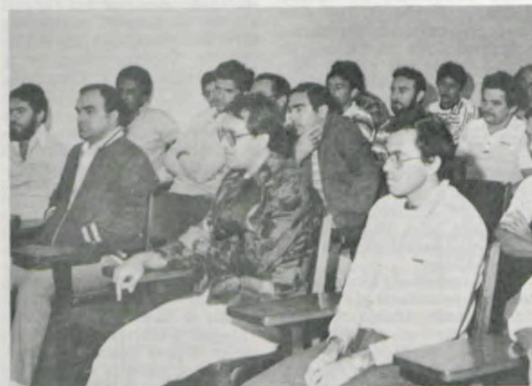
Integrantes do 6.º Curso, na solenidade de abertura.