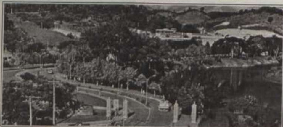
O campus da UFV é considerado um dos mais belos do País.

Além disso, todos os semestres são oferecidos diversos cursos, como os de Violão, Música, Desporto Livre, Artes Cênicas etc., e atividades práticas como o Conjunto de Flauta Doce, Conjunto de Sopros e o Coro da Universidade.