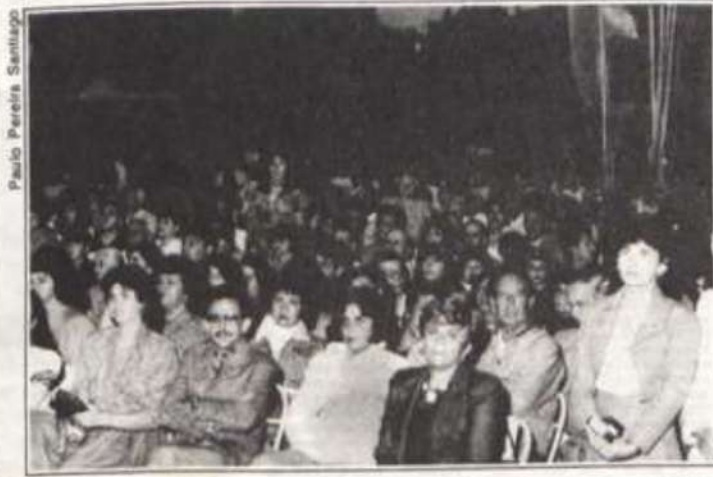
Aspecto geral dos jardins do Edifício Arthur da Silva Bernardes, durante a cerimônia.