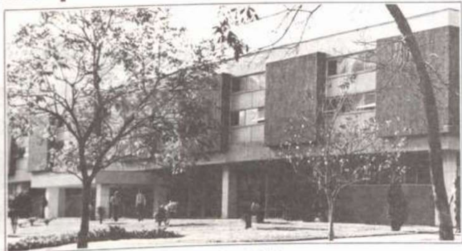
Biblioteca Central da UFV.