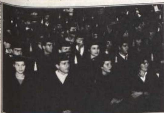
Formandos de Agosto de 1990.

O final da sessão solene de colação de grau foi marcado por um belíssimo espetáculo pirotécnico, quando uma verdadeira cascata de fogos de artifício encantou os presentes.