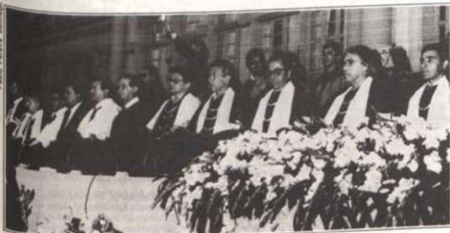
Autoridades presentes à sessão solene.

C olaram grau hoje, na Universidade Federal de Viçosa, 221 formandos em 20 cursos nas áreas de ciências agrárias, ciências exatas e tecnológicas, ciências biológicas e da saúde e ciências humanas, letras e artes. Na ocasião, seis doutorandos e 52 mestrandos receberam seus títulos de pós-graduação.