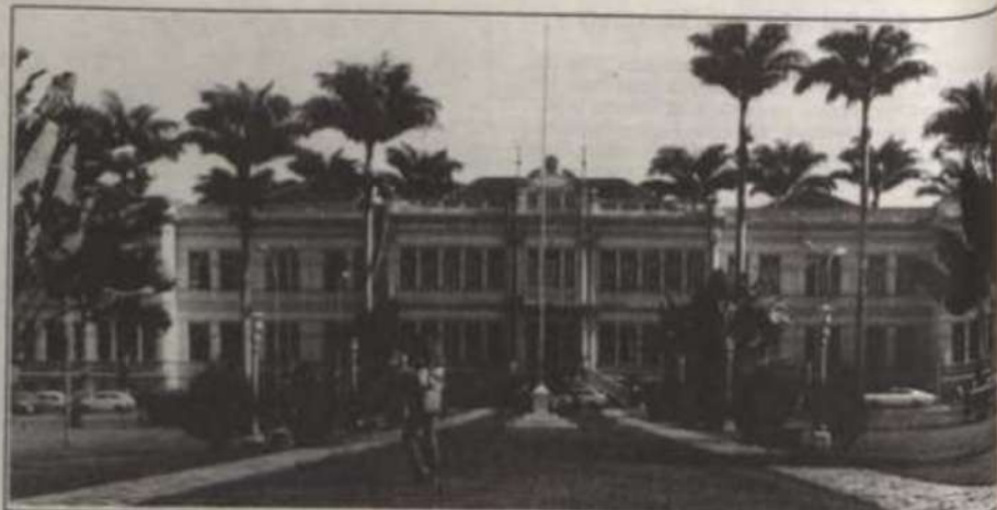
Edifício Arthur da Silva Bernardes.

São estes os cursos oferecidos pela UFV, em nível de graduação: Administração, Agronomia, Biologia, Ciências Econômicas, Economia Doméstica, Educação Física, Engenharia Agrícola, Engenharia Civil, Engenharia de Agrimensura, Engenharia de Alimentos, Engenharia Florestal, Física, Informática, Letras (Português/Francês e Português/Inglês), Matemática, Medicina Veterinária, Nutrição, Pedagogia, Química, Tecnólogo em Cooperativismo, Tecnólogo em Laticínios e Zootecnia. São estes os cursos de pós-graduação: Agroquímica, Ciência Florestal, Ciência e Tecnologia de Alimentos, Economia Rural, Engenharia Agrícola, Entomologia, Extensão Rural, Fisiologia Vegetal, Fitopatologia, Fitotecnia, Genética e Melhoramento, Meteorologia Agrícola, Microbiologia Agrícola, Solos e Nutrição de Plantas e Zootecnia (mestrado); Ciência Florestal, Economia Rural, Engenharia Agrícola, Fisiologia Vegetal, Fitopatologia, Fitotecnia, Genética e