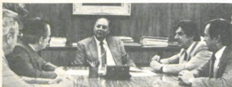
O Presidente Aureliano Chaves e a comitiva de líderes de Viçosa.