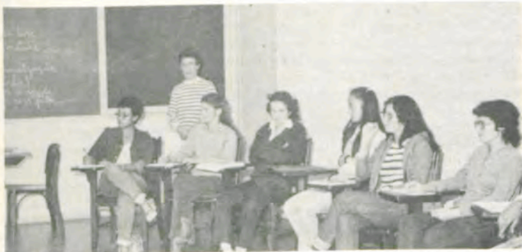
Grupo de participantes do treinamento.