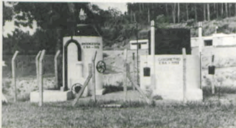
O conjunto já completamente recuperado.

Também mostra que o biodigestor pode ser instalado próximo à moradia rural — a uma distância média de 15 metros — e que o transporte do biogás para uso doméstico é muito simples, sendo feito até através de tubos de plástico. Outra vantagem do processo é a transformação dos detritos em adubo orgânico de alta qualidade, após a fermentação.