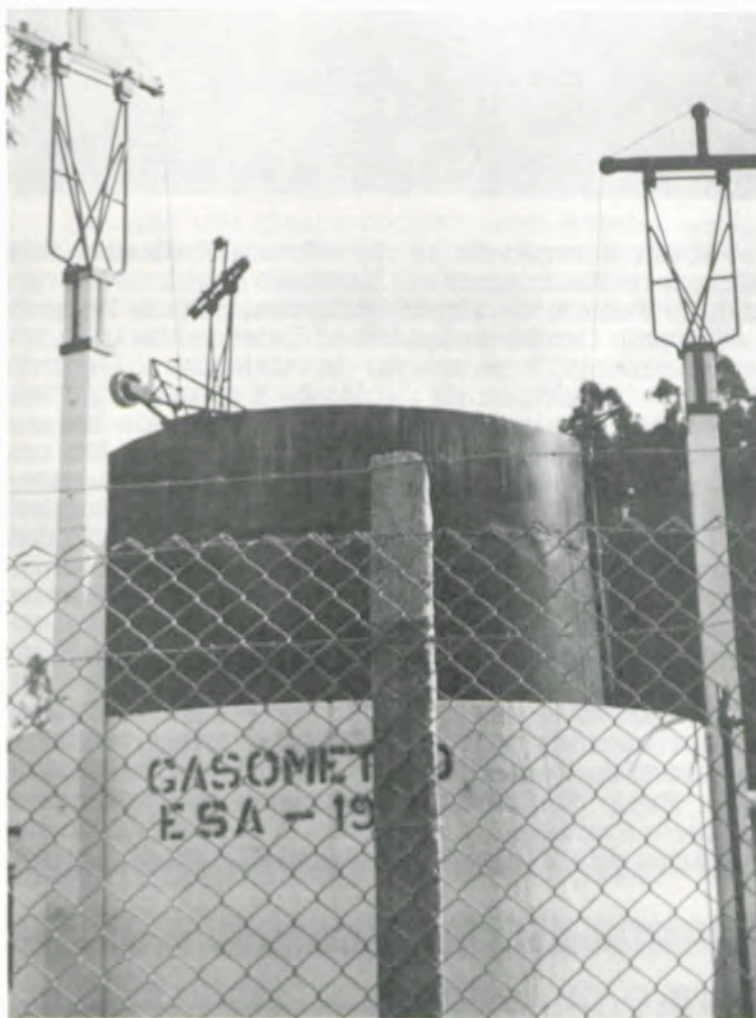
O gasômetro também foi construído em 1953.