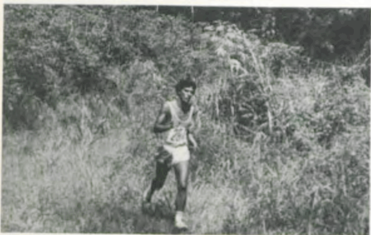
O vencedor no meio do bosque.