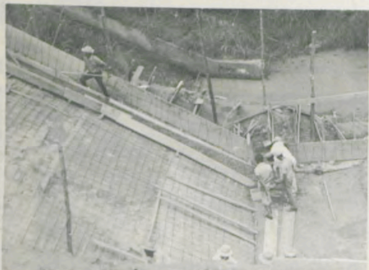
Outra vista da construção do vertedouro.