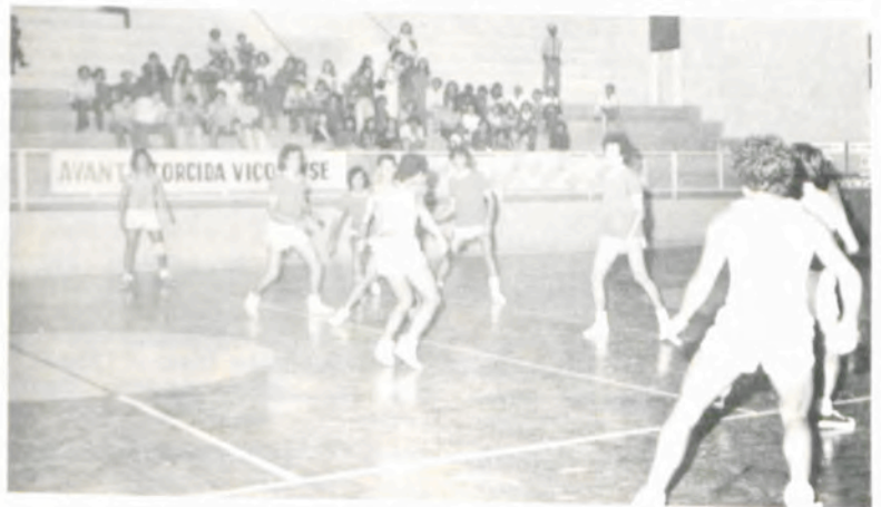
Handebol entre Carangola e Rio Branco.