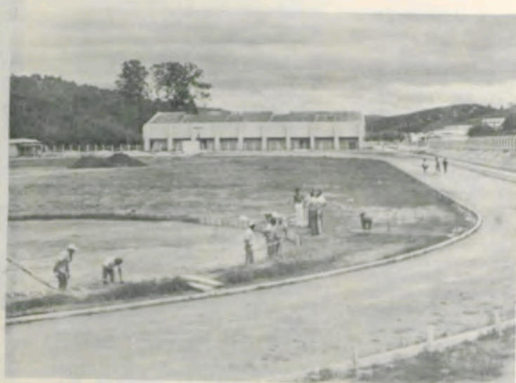
Estão quase concluídas as obras da área de atletismo.

A partir desta semana, foi intensificado o plantio de grama nas seguintes áreas: trecho que vai do Serviço de Material ao Estábulo, entre a linha férrea e a avenida; trecho Centro de Ensino de Extensão-Biblioteca Central, ao longo da ferrovia; trecho Biblioteca Central-Centro Social; trecho Centro Social-Ciências Domésticas; trecho Ciências Domésticas-Instituto de