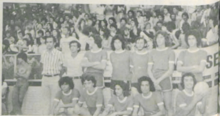
A equipe de vôleibol de Viçosa.

Entre outras coisas, disse o reitor: - "A capacidade, inteligência e o vigor físico destacam neste instante que, juntamente com a Diretoria de Esportes de Minas Gerais e com as prefeituras municipais, tornamos realidade de esta promoção, que objetiva uma competição sadia entre a nossa juventude e entre as nossas comunidades. Queremos dar as boas vindas à Universidade e, temos certeza, do povo de Viçosa, a todas as delegações que nos visitam."