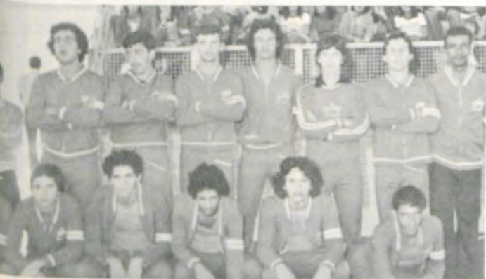
A equipe de handebol de Carangola.