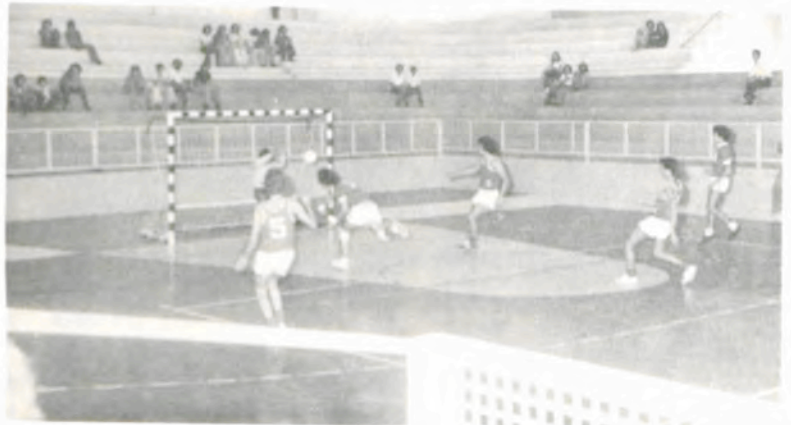
Um lance do handebol entre Raul Soares e Ubá.