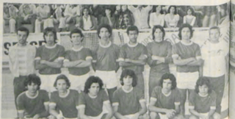
A equipe de handebol de Rio Branco.