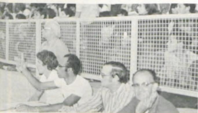
A fiscalização dos jogos.