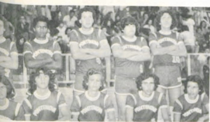
A equipe de vôleibol de Ponte Nova.