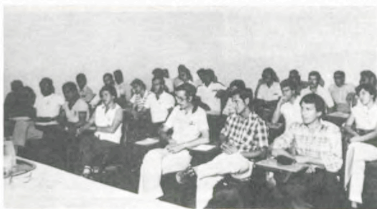
18 técnicos participam do curso.