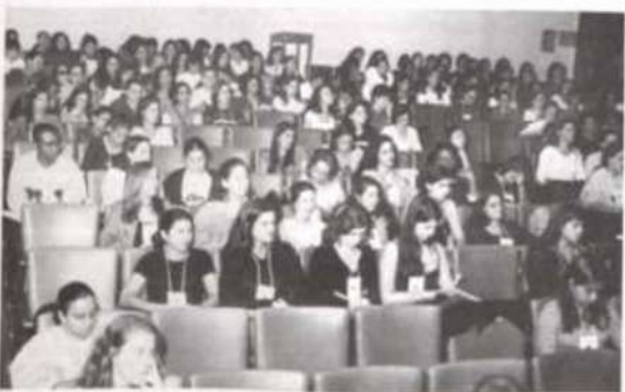
Parte do público presente à abertura do evento.

Foi realizada no período de 11 a 13 deste mês, no Auditório do Departamento de Economia Rural da Universidade Federal de Viçosa, a IX Semana de Economia Doméstica, que reuniu profissionais e estudantes da área para discutirem o tema "O Profissional de Economia Doméstica Rumo ao Novo Milênio".