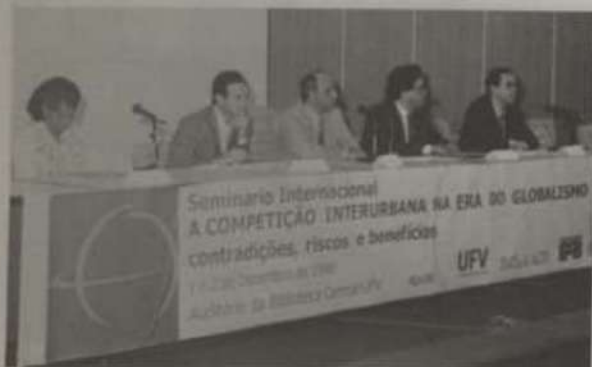
Personalidades presentes à solenidade de abertura.

"A Competição Interurbana na Era do Globalismo: contradições, riscos e benefícios" foi o tema do Seminário Internacional realizado no auditório da Biblioteca Central (BBT) da Universidade Federal de Viçosa, nos dias 1º e dois deste mês. A promoção foi do Núcleo de Estudos e Pesquisas Urbanas e Rurais do Departamento de Arquitetura e Urbanismo (DAU), com apoio