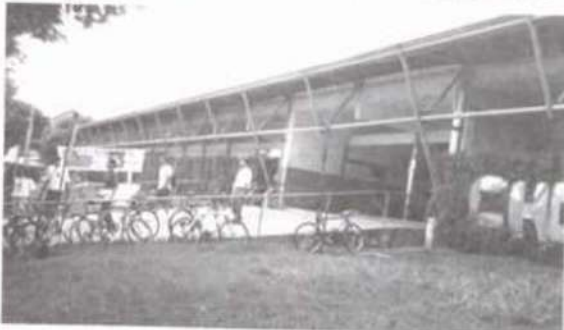
Vista da entrada do prédio.

Atendendo às várias solicitações de professores e estudantes, que reclamavam do desconforto do prédio do Pavilhão de Aulas (PVA), a Pró-Reitoria de Administração da Universidade Federal de Viçosa vem realizando várias reformas no edifício, com o objetivo de eliminar goteiras e infiltrações, diminuir o calor no ambiente e melhorar o seu visual, visando ainda, com estas medidas, aumentar o conforto dos usuários e o rendimento das aulas.