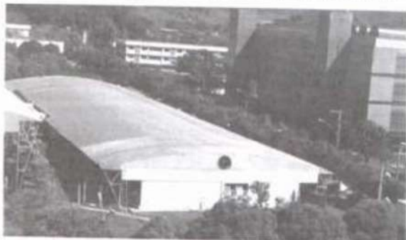
O telhado ganhou nova e moderna cobertura.

em dezembro do ano passado. A empresa foi responsável pela fabricação, pelo fornecimento e