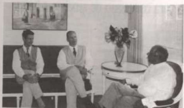
Os empresários americanos (à esquerda), em visita ao reitor.

da na cidade de Cortland (New York-EUA), que atua na área de comércio internacional de madeiras de folhosas, com escritórios nos Estados Unidos, no Canadá, Japão, na Itália, Bélgica e Coreia do Sul.