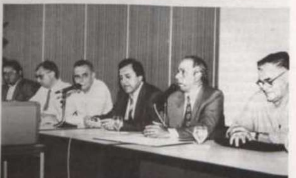
Autoridades que formaram a mesa de abertura do Simpósio.