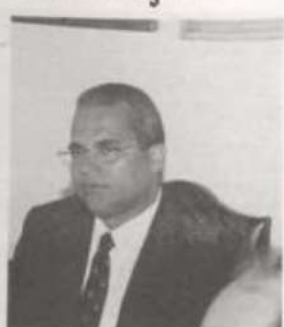
O presidente do CNE, Éfrem Aguiar.

A definição do perfil desse profissional está ligada à escolha dos elementos essenciais em sua formação, em consonância com as demandas da sociedade. Isso requer treinamento de recursos humanos e a adequação da infra-es-