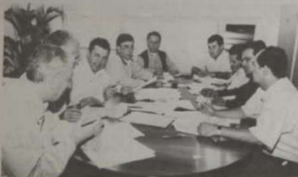
Participantes da reunião.

* Professores do Departamento de Educação da UFV.