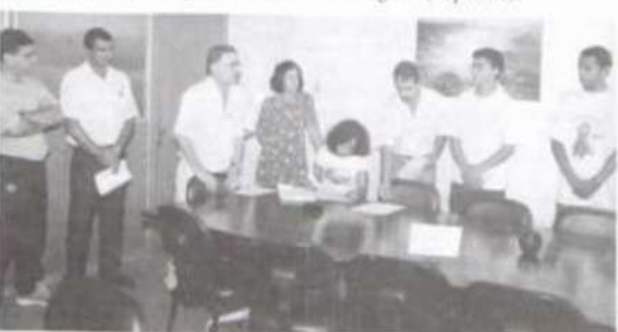
Os representantes assinam o termo de posse.