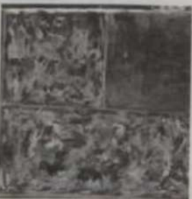
Uma das obras do artista.