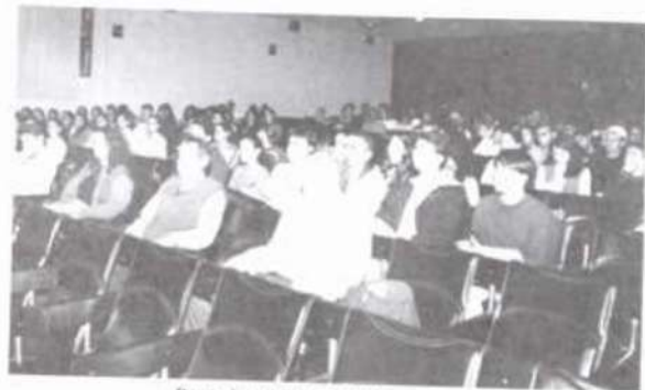
Parte do público presente ao evento.