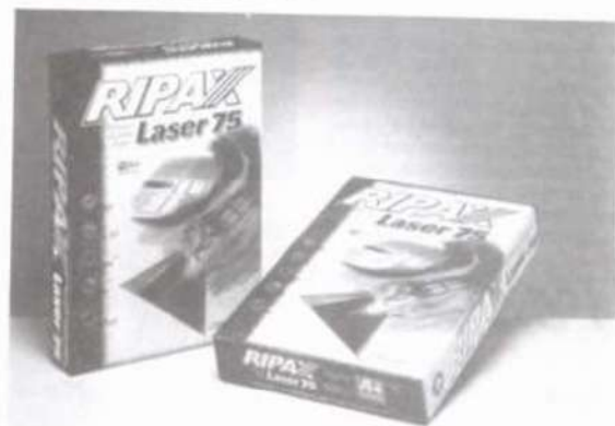
Um dos novos produtos da Ripasa.