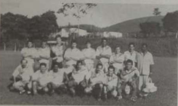
A equipe vencedora do campeonato.