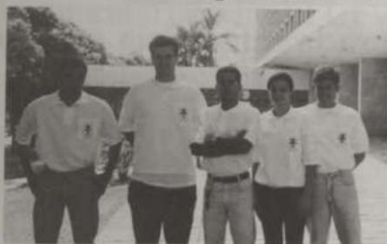
Equipe responsável pela realização do curso.

Em razão da grande aceitação por parte do público e atendendo