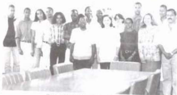
Os estudantes estrangeiros do PEC-G.

assinado recentemente, bem como a reformulação de suas normas, quando algumas dúvidas levantadas pelos estudantes foram esclarecidas.