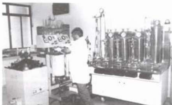
O LCP possui modernas instalações.

Modificações de processos convencionais de polpação e branqueamento, bem como estudos de redução da carga poluente dessas etapas de produção da polpa branqueada; Processos de branqueamento de celulose de baixa carga poluente; Estudos de tratamento