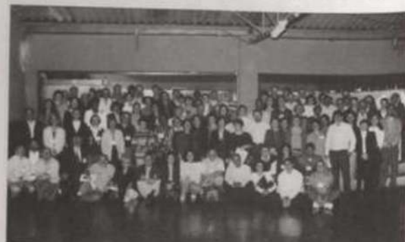
Alguns dos editores presentes no encontro.