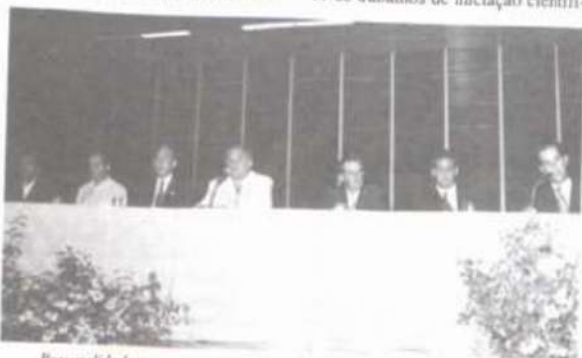
Personalidades que comeram a mesa-de-honra da cerimônia de abertura.