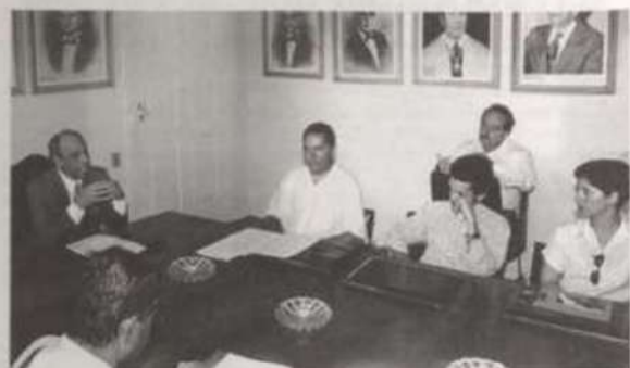
O reitor da UFV anuncia a criação da AIP.

Universidades como a USP e a UFMG, por exemplo, já adotam este