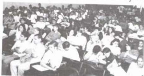
Participantes de um dos debates, no auditório do DEF.

cou o reinício das atividades desse fórum oficial do movimento estudantil, que não se reunia desde 1991. Além de discutir os rumos da UNE, os participantes procuraram definir a posição dos estudantes