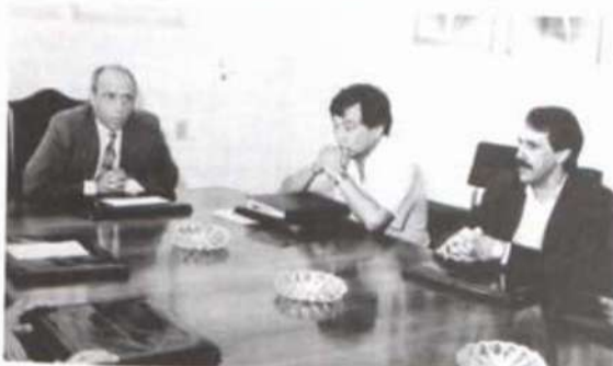
Reunião em que se implantou a Ouvidoria.

Os acessos da Ouvidoria são os seguintes: telefone (031) 899-1743; fax (031) 899-2108 e e-mail ouvidor@mail.ufv.br.