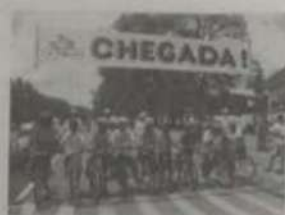
Largada da prova.