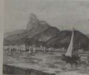
Um dos trabalhos da mostra.