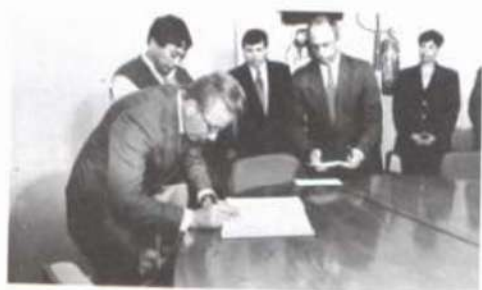
O novo diretor assina o termo de posse.

sidade Purdue (EUA). Em seu discurso de posse, declarou que assume o cargo com muita responsabilidade, em razão de o Instituto atender a mais de 20% da população de Viçosa.