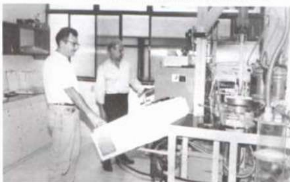
Outros dos equipamentos disponíveis.

Recentemente, importantes periódicos do setor realizaram reportagem com o LCP. São eles: Revista "Celulose e Papel", editada pela Associação Nacional dos Fabricantes de Papel e Celulose, de São Paulo, em sua edição n.º 56, de 1996; Revista "O Papel", da Associação Brasileira Técnica de Celulose e Papel, de São Paulo, em junho de 1997; e, provavelmente a mais importante revista técnica sobre papel e celulose, a "Tappi Journal", editada pela Associação Técnica das Indústrias de Celulose e Papel dos Estados Unidos, de Atlanta, em setembro último.