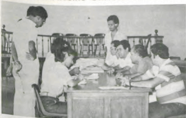
A apuração teve lugar no Salão Nobre do Edifício Arthur da Silva Bernardes.

Transcorreram em clima de normalidade as eleições para indicar os representantes dos servidores técnicos e administrativos, junto ao Conselho Universitário da Universidade Federal de Viçosa (UFV), levadas a efeito no dia 30 de março último, em diversos locais do «campus» universitário.