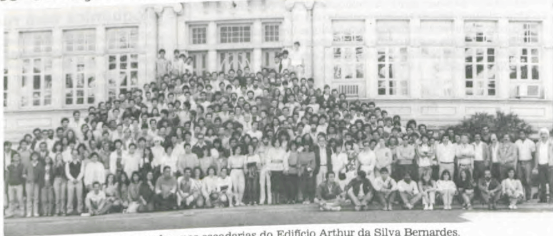
Os formandos, nas escadarias do Edifício Arthur da Silva Bernardes.