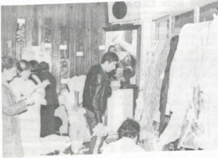
Exposição de Artesanato.

Minas Gerais foi o Estado que teve maior número de representantes, com 1.740 pessoas. Seguem-se os Estados do Rio de Janeiro (297), Espírito Santo (96), São Paulo (67), Mato Grosso do Sul (36), Distrito Federal (18), Goiás (16), Bahia (14), Paraná (12), Pernambuco (cinco), Sergipe (dois), Piauí e Santa Catarina (um). Destacaram-se, pelo número de representantes, as cidades de Viçosa (264), Caratinga