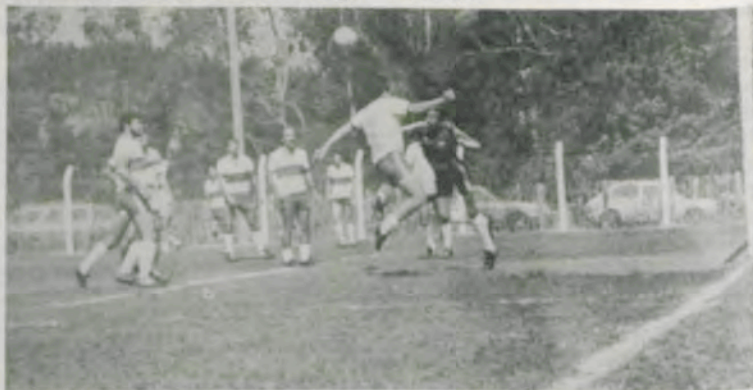
Um dos muitos ataques da Seleção da ASPUV.