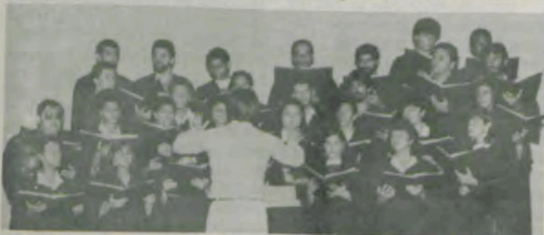
O Coral da UFV foi muito aplaudido em sua apresentação na Semana da UFV.