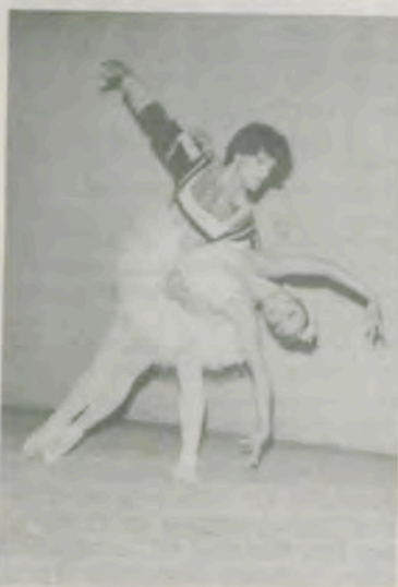
A beleza do balé clássico.