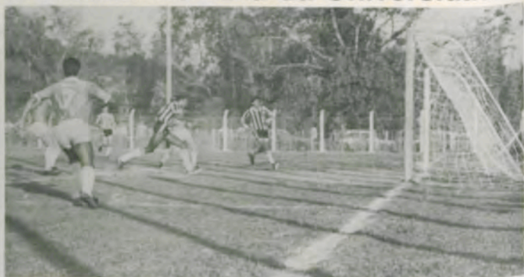
O primeiro gol da Seleção da UFV.

Em partida amistosa realizada dia 28, em Viçosa, a equipe de juniores do Clube Atlético Mineiro empatou em 2 a 2 com a seleção da Universidade Federal de Viçosa. O jogo foi realizado no Estádio Paulo Mário del Giudice e fez parte das comemorações do 60.º aniversário de fundação da UFV.