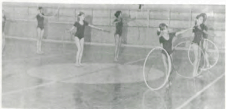
Ginástica rítmica desportiva.