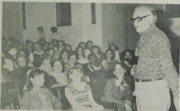
O escritor Orígenes Lessa durante os debates.

Com uma conferência do escritor Orígenes Lessa sobre «A narrativa infantil», foi encerrada, no último dia 19, na Universidade Federal de Viçosa, a II Semana de Letras, promovida pelo Conselho de Extensão e pelo Departamento de Letras e Artes da UFV.