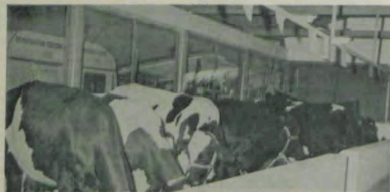
Alguns dos animais expostos em Ponte Nova.

Para estimular os pecuaristas da região a adquirirem animais de alta capacidade genética para produção, a UFV, por meio do Departamento de Zootecnia, tem enviado exemplares de seus animais às exposições agropecuárias. Agora, em Ponte Nova, foram expostos animais das raças Holandesa, Charolesa e Devon, além de outros de diversos graus de sangue da raça Holandesa.