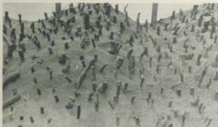
«Queimadas Semeiam Desertos».

Brasília, 24 de julho de 1980; 159.º da Independência e 92.º da República. JOÃO FIGUEIREDO, Ernane Galveas e Antonio Delfim Neto.