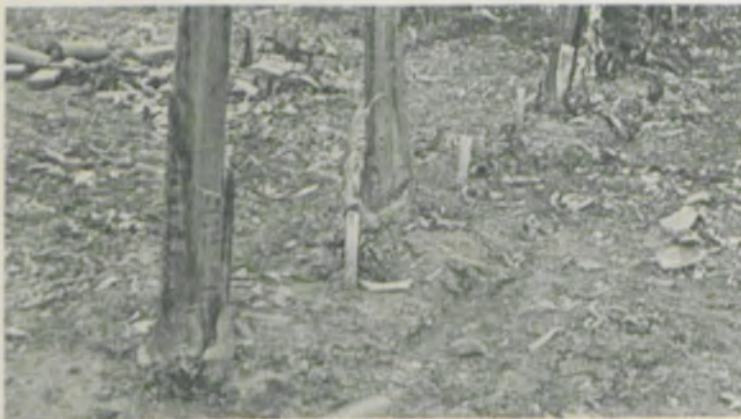
Virar a parte cortada para baixo, de modo que fique em contato com o solo, ao lado da touceira.