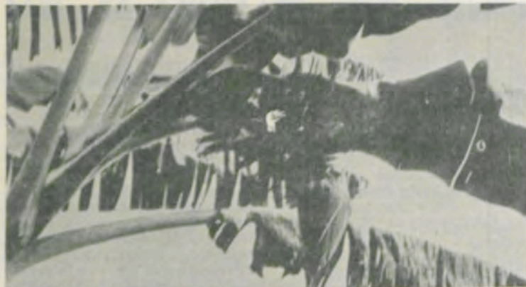
Com o ataque, os cachos apresentam-se em tamanho reduzido e mal formados.

Os prejuízos podem ser grandes, pois muitas vezes o agricultor não percebe o ataque desta praga, visto que a broca se movimenta à noite e, durante o dia, fica escondida da luz do sol, debaixo de restos do bananal.