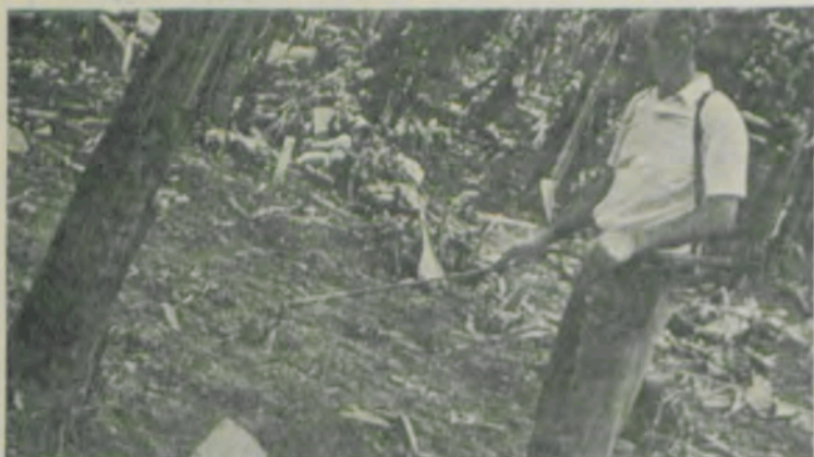
Pulverizar a parte cortada dos pedaços de bananeira com a calda inseticida.

1) Tomar pedaços de bananeira de mais ou menos 50 centímetros de comprimento; 2) cortar os pedaços ao meio com um facão; 3) pulverizar a parte cortada com a calda inseticida; 4) distribuir os pedaços de bananeira no bananal, perto da touceira. Normalmente gastam-se 40 pedaços por hectare; 5) Virar a parte cortada para baixo, de modo que fique em contato com o solo, ao lado da touceira; e, 6) Atenção: repetir a pulverização 15 a 21 dias após a primeira aplicação, usando-se novas iscas".