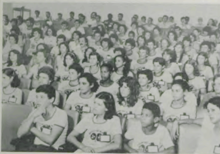
Vista parcial do plenário.