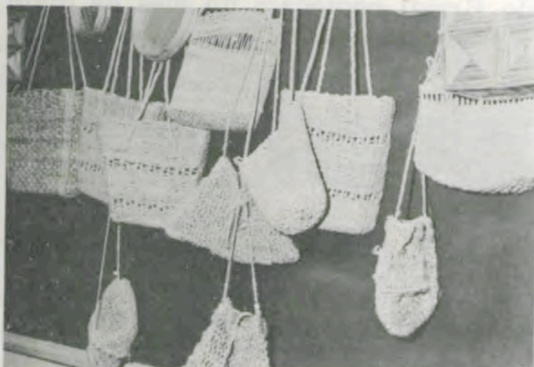
Alguns trabalhos da Exposição de Artesanato.

Foi realizada, dias dois e três do corrente, na Universidade Federal de Viçosa (UFV), a Convenção Regional de Clubes 4-S, reunindo cerca de 150 participantes, entre jovens ruralistas e produtores rurais de 23 municípios da região de Viçosa, em comemoração aos 30 anos de Clubes 4-S no Estado, pioneiro no País.