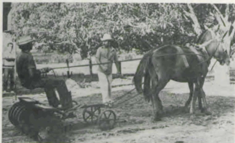
Demonstração prática do uso da tração animal.