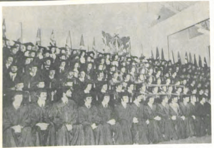
Os formandos de 1974 da Universidade Federal de Viçosa.