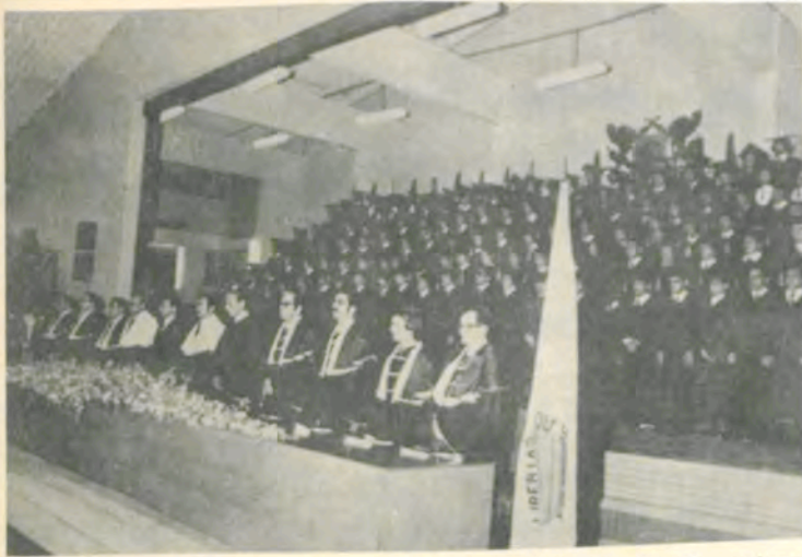
A mesa que dirigiu os trabalhos da solenidade de formatura, hoje à noite, no Ginásio de Esportes da UFV.