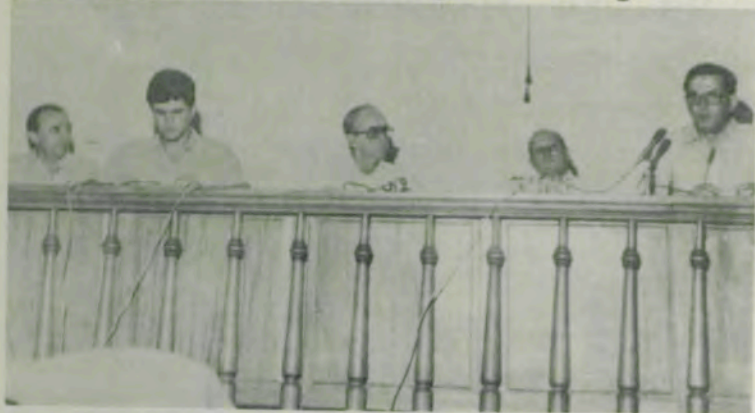
Os participantes do painel.

Com o painel "Reforma Agrária: Eficiência e Equidade", terminou, sexta-feira, a XII Semana do Engenheiro-Agrônomo, promovida pela Universidade Federal de Viçosa (UFV), por intermédio do Conselho de Extensão, Centro de Ciências Agrárias e Centro Acadêmico de Agronomia, com ciclo de conferências e nove cursos de especialização.