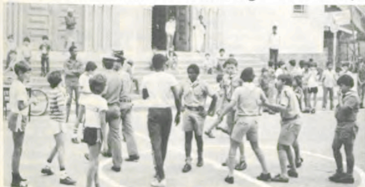
A Polícia Militar e o Grupo Escoteiro de Viçosa colaboraram para o êxito do Domingo na Praça.

Considerado pelos organizadores como o melhor e o mais movimentado de todos, foi realizado dia 17, na Praça Silviano Brandão, em Viçosa, o V Domingo na Praça, com jogos, dança e variada programação cultural, comemorando as Semanas da Criança e da Polícia Militar e o Dia do Professor.