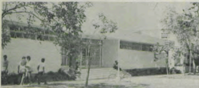
Um dos pavilhões do CEE.

Outros pormenores poderão ser obtidos no CEE — «Campus» Universitário — 36570 — Viçosa-MG, ou através do telefone (031) 891-1523, com o engenheiro-agrônomo Ney São José.