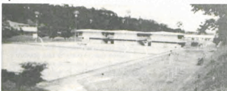
Vista parcial das instalações do Departamento de Educação Física.