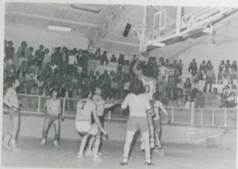
O incentivo da torcida é sempre marcante para as grandes vitórias da UFV.