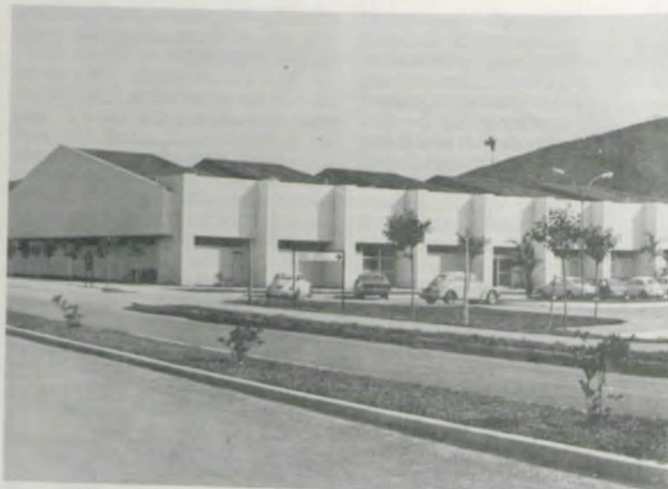
O Ginásio de Esportes da UFV é dotado de todas as facilidades para a prática do esporte.