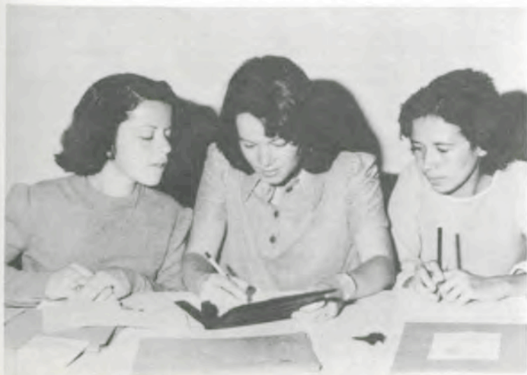
As alunas de pedagogia trabalharam muito para a realização da I Mini-Feira de Ciências.

Os alunos de todas as escolas de primeiro e segundo graus vão participar da I Mini-Feira de Ciências, que será realizada no próximo domingo, na Escola Superior de Florestas da Universidade Federal de Viçosa.