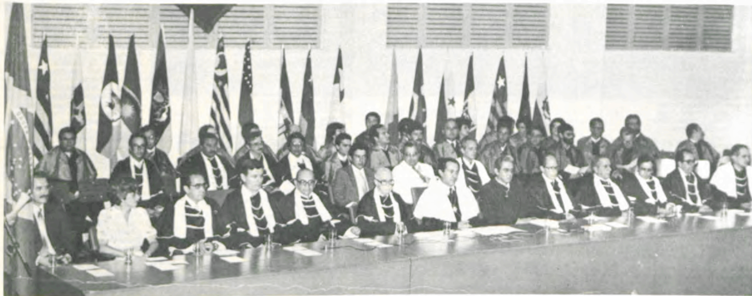
A mesa diretora da sessão solene, no Ginásio de Esportes.