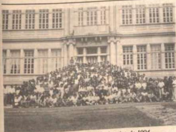
Os formandos da Turma de Janeiro de 1994.

As solenidades de formatura da Turma de Janeiro de 1994 acontecerão dias 14, 15 e 16 de janeiro, obedecendo à tradição da Universidade Federal de Viçosa. Na sexta-feira, 14, a partir das 18 h, acontecerá a Sessão Solene de Colação de Grau, no Ginásio de