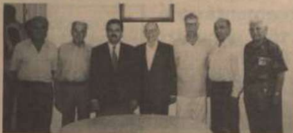
Alguns dos associados presentes à inauguração da Casa do Ex-Aluno.

Participaram da inauguração autoridades universitárias, ex-alunos e seus familiares e pessoas da comunidade universitária.