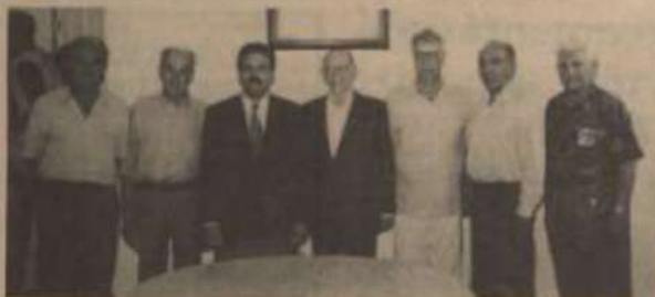
Alguns dos associados presentes à inauguração da Casa do Ex-Aluno.

A Casa do Ex-aluno, antiga reivindicação dos membros da Associação, foi inaugurada no dia 10, ao meio-dia, logo depois de encerrada