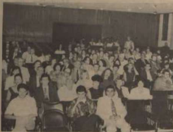
Participantes da solenidade.