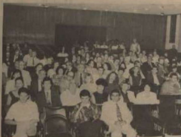
Participantes da solenidade.