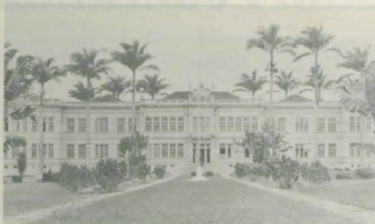
O edifício Arthur da Silva Bernardes.

O ensino de 1º e 2º graus é também uma preocupação da UFV, e, em convênio com a Secretaria de Educação de Minas Gerais, mantém cerca de 700