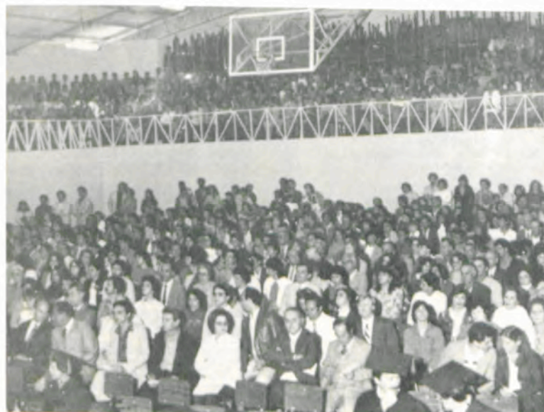
Parte do público presente à solenidade.