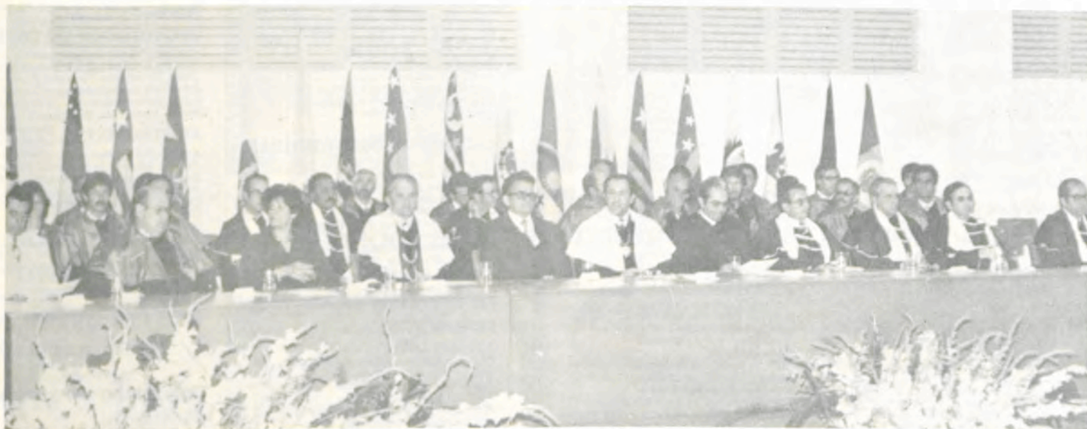
A mesa diretora da sessão solene, no Ginásio de Esportes.