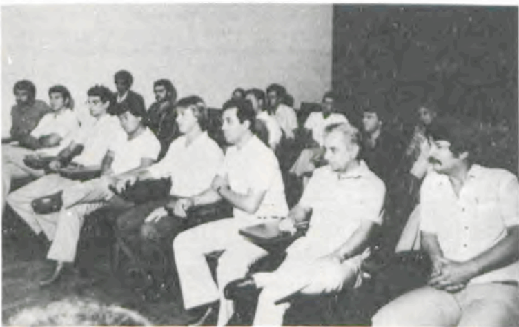
Os agrônomos do Banco do Brasil, região Sul.

Os agrônomos são dos Estados do Rio Grande do Sul (10), Santa Catarina (4), Paraná (3) e São Paulo (2).