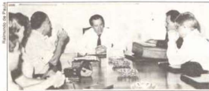
O encontro entre o reitor da UFV e os visitantes transcorreu em clima de cordialidade.