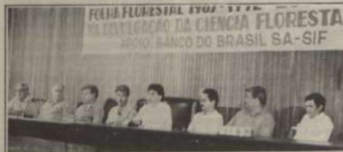
Aspecto da abertura do Seminário.