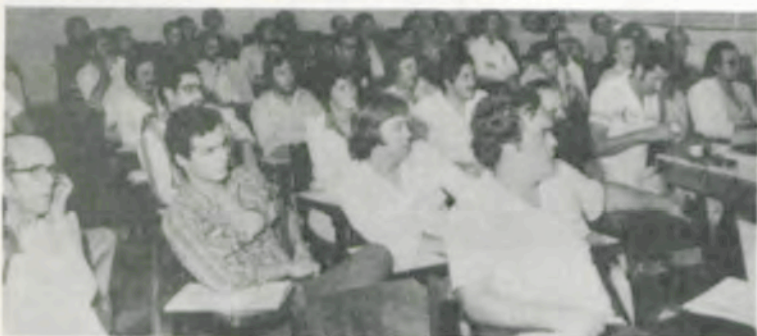
Os técnicos, no CEE, assistindo à apresentação dos trabalhos sobre a cana-de-açúcar.

No dia 11, das 14h às 18h, foram constituídos quatro grupos de trabalho, para atualização das recomendações técnicas para a cultura da cana-de-açúcar, a nível da região da Zona da Mata. No dia 12, pela manhã, os participantes visitaram as instalações da destilaria de álcool «Mário Bouchardet Júnior», anexa à Usina São João, em Visconde do Rio Branco.