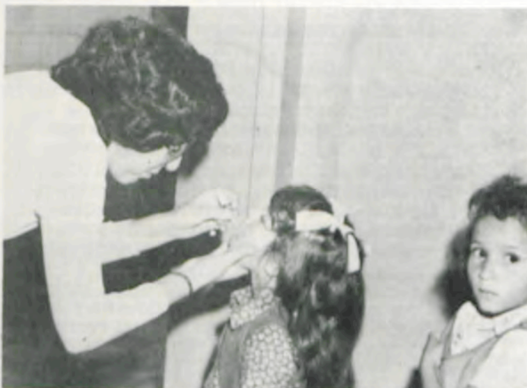
Uma criança sendo vacinada na Escola Estadual Effe Rolfs, no campus da UFV.

A vacinação continua sendo feita no Centro de Saúde de Viçosa, nas crianças de zero a cinco anos. A segunda vacinação será executada no dia 16 de agosto próximo, nos 25 postos.