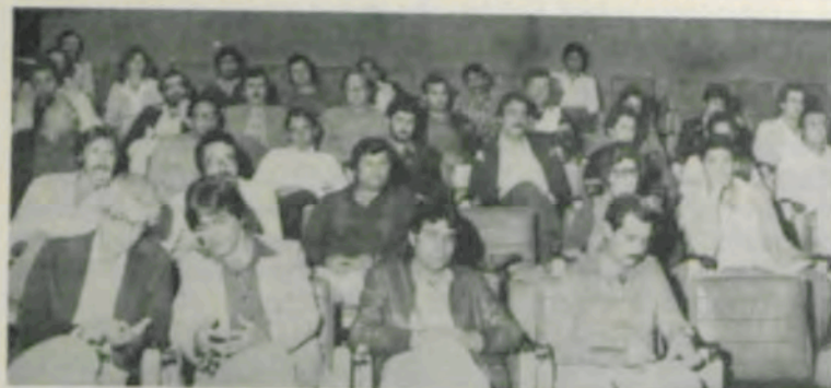
Os participantes do seminário.