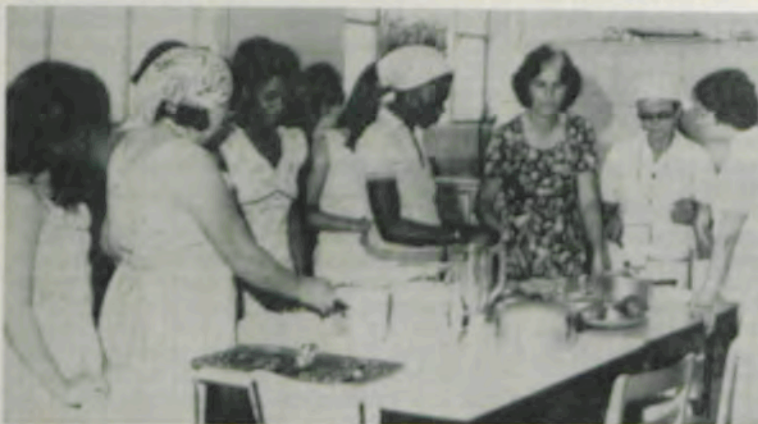
Aula prática sobre alimentos.

O curso, que beneficiou estabelecimentos de ensino da região de Viçosa, teve aulas sobre ajuste profissional, importância da merenda escolar, montagem de uma cantina — uso, conservação e limpeza de equipamentos e utensílios domésticos, grupo de alimentos, formulação de cardápios para merenda escolar, tabus alimentares, relação entre problemas de saúde e higiene dos alimentos, asseio corporal e socorros de urgência.